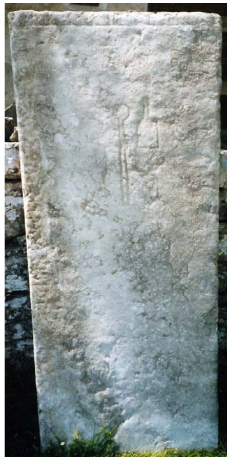
G 250. Foto: Thorgunn Snædal 2003.