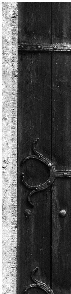
G 249. Runinskrift utmed dörppostens yttre(södra) sida. Foto: Bengt A. Lundberg 1989.

»Detta är kyrkoprästernas (eller -prästens) och sockenmännens vittnesbörd, att Hellvisborna äga, medelst köp, för all framtid(?) kyrkoväg genom Lilla Foles gårdar(gården).»