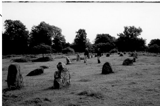
Skeppssättning i bra skick