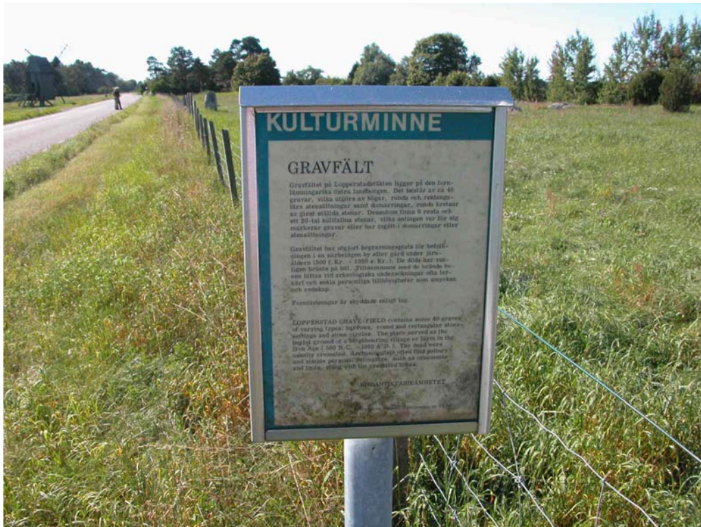
En äldre sliten skylt finns i anslutning till en liten parkering och färirst. Stängsel är uppsatt för fårbeta.