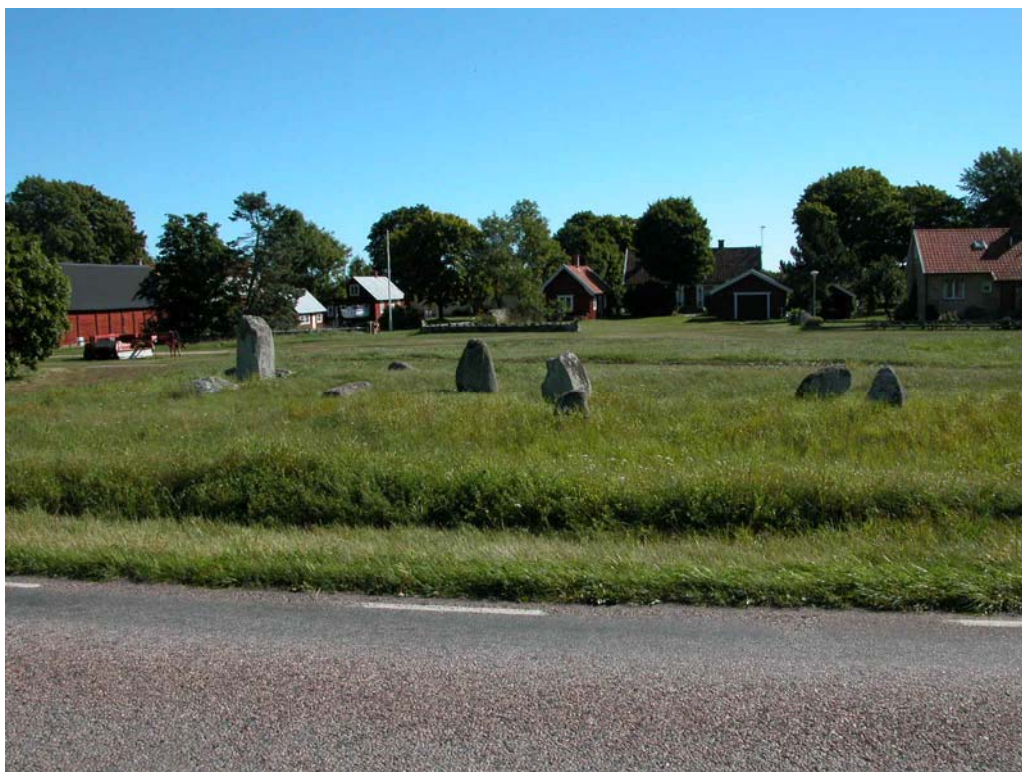
Gravfältets resta stenar var i relativt dåligt skick med flera omkullvälta stenar. I den sydvästra delen syns ännu spåren av en grustäkt. Flera vägar går genom området.