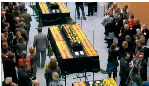
Drygt 400 gäster och medarbetare firade att ämbetet äntligen är på plats i Visby.

Kulturministern betonade Riksantikvarieämbetets centrala roll när det gäller uppgiften att vårda och bevara kulturarvet och talade varmt om det nya husets möjligheter att främja sådan verksamhet.