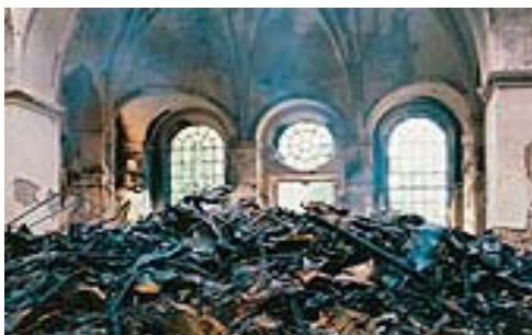
Med checklistor, sunt förnuft och små medel kan storverk uträttas när katastrofen är framme. Bild från Katarina kyrka.

Läs mer om den interaktiva handboken på: www.raa.se/rvr