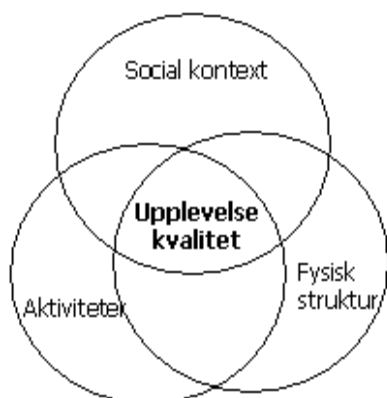
Bild 4. Upplevelsekvaiteter i den byggda miljön (Ahrentzen, 2002)

social nivå eller som livsstil, samt fysisk struktur beskriven i form av densitet, arkitektoniska detaljer eller gatustruktur.