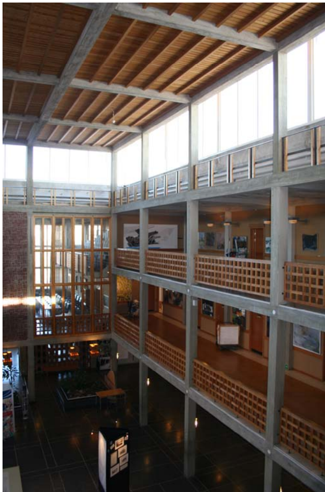
Stadshuset, som idag är byggnadsminne, är ritat av Artur von Schmalensee och invigdes 1963. Den stora salen i byggnaden används som mötes- och utställningslokal och kallas ibland "kirunabornas vardagsrum".

Byggnadsminnena och kyrkan ligger inom de delar av Kiruna som kommer att drabbas av markdeformationer. Se karta sidan 13. Det är nödvändigt att ta ställning till hur dessa byggnader ska hanteras i kommande förändringssituation. Alla beslut om förändringar av byggnadsminnena fattas av länsstyrelsen, men rivning eller flyttning kräver också beslut av kommunen.