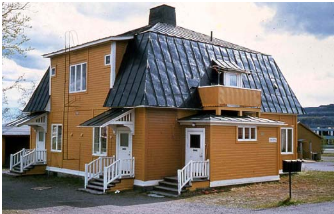
Ett exempel på en sexrums arbetarbostad i Kiruna (s.k. Bläckhorn) som ritades av arkitekten Gustaf Wickman och byggdes i ett stort antal för två familjer och två ungarlar. Byggnaden på bilden uppfördes 1907. Listornamentiken har senare delvis avlägsnats och övermålat.

ingenjörsbostäderna. Lundbohm själv nöjde sig med en tillbyggd parstuga, utan någon maktsymbol i form av torn som var så vanligt i samtida direktörsboställen.