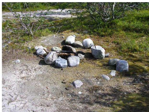
Figur 27. Modern eldstad, anlagd på en stenåldersboplat - en vanlig syn i Rogenreservatet.