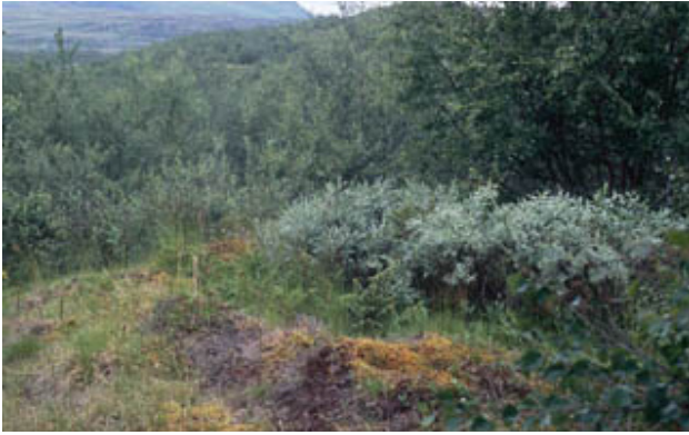
Figur 4. Kåtalämning bevuxen med vid i Gamla Luoppal.