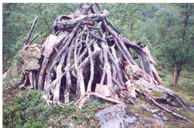
Figur 22. Klykstångskåta i Gråsjödörren.