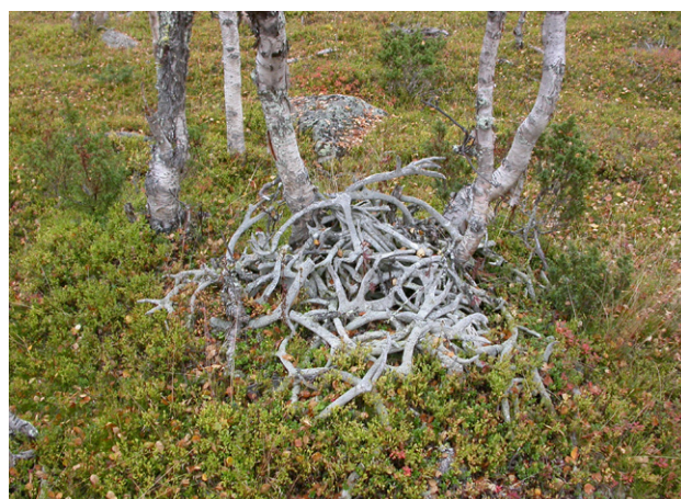
Figur 16. Hornsamling.