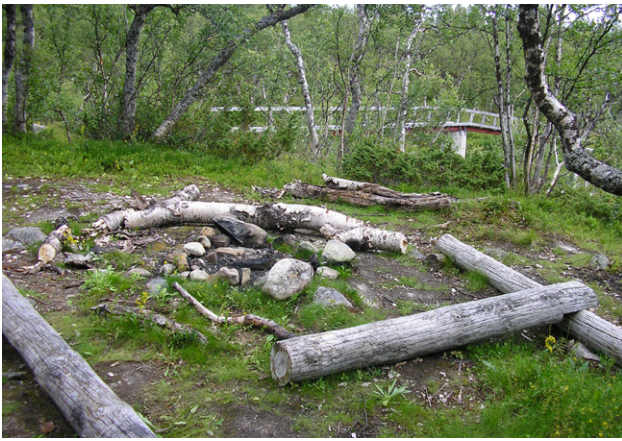
Figur 23. Förfallen kåta i Stensdalen.