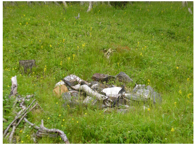
Figur 29. Eldstad på stranden i Ovrehøjke.

Området användes tidigare för fäbodrift och i slutet av 1800-talet fanns minst 100 kor och lika många får och getter. Den sista fäbodvallen lades ned år 1971. Inom re-