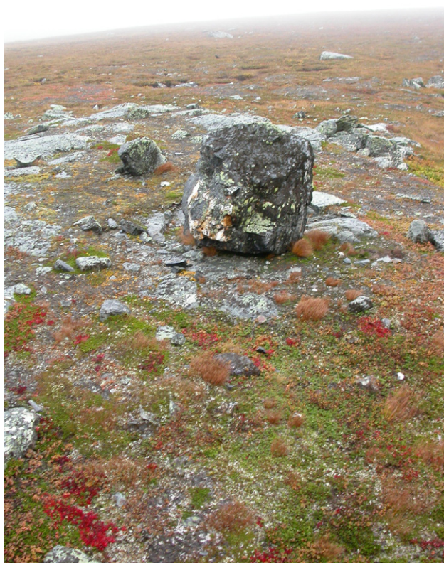
Figur 17. Offerplats.

Redan på 1850-talet skrev länsman Eleazar Rhen att det fanns en offersten på nordvästra sidan av Marsfjället. Offerstenen (RAÄ 49) består av ett massivt manshögt stenblock med insprängda kvartsgångar, som gör att