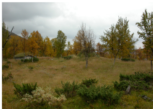
Figur 14. Vistet vid Norra Aavnerejaevrie.

I ett område mellan två mindre tjärnar finns elva hornsamlingar och en kåtatomt (Figur 16). Ett mindre vedupplag ligger på en av hornsamlingarna.