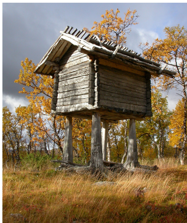
Figur 13. Gåsfotsbod i Groenienjälla.

På uppdrag av länsstyrelsen genomförde Västerbottens museum en inventering av byggnader i Västerbottensfjällen under åren 1978 – 1980. Vilhelmina kommun inventerades år 1980 och ett flertal visten i Marsfjällsen registrerades. Ett härbre i nedre delen av Groenienjälla restaurerades med hjälp av byggnadsvårdsmedel år 1994. Härbret är en så kallad gåsfotsbod, som har tillhört Jon Mikaelsson (Figur 13). Samiska byggnader har även renoverats och underhållits av privatpersoner. Vissa av de byggnaderna är fortfarande i bruk.