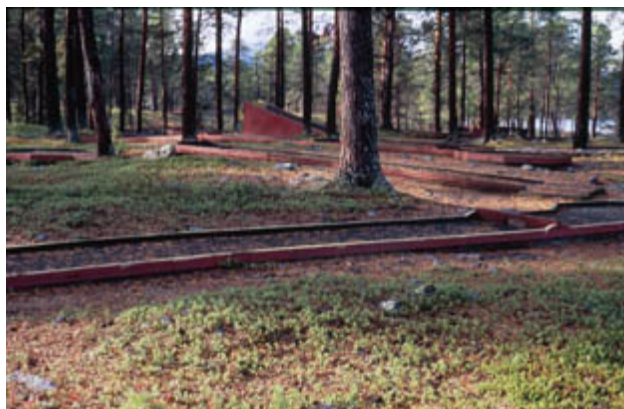
Figur 6. Kokgrop och minigolfbana i Årrenjarka.

Stigen är spångad över sankarpartier, men flera sträckor skulle behöva spänger. Stigen var vid besöket i september 2006 mycket vältrampad, eftersom ett 50-tal skolbarn hade gått här dagen innan. Inga skador på natur, kultur lämningar, turistanläggningar, vindskydd, eldplatser eller dass kunde upptäckas.