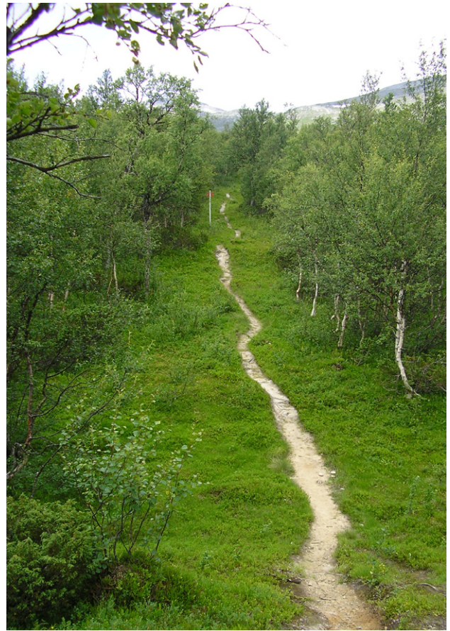
Figur 25. Turistleden går rätt igenom vistet.

Rogens naturreservat ligger i Härjedalens kommun i sydvästra delen av landskapet och gränsar mot Långfjällets naturreservat i norra Dalarna. Reservatet bildades år 1976 och bestämmelserna reviderades 1993. Fastighetsägare är ett antal privatpersoner och Fastighetsverket. Rogen är ett sjörikt lågfjällsområde med mängder av sjöar, uddar, holmar och öar. Det högsta fjället är Brattriet (1276 m).