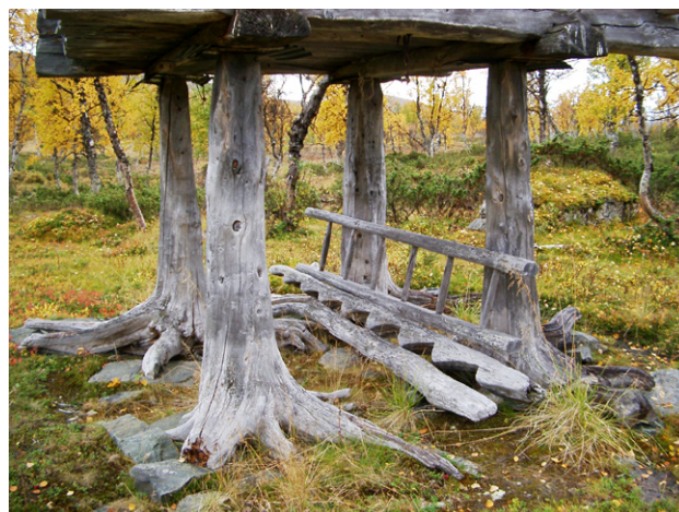
Figur 15. Detaljer från Skotts gåsfotsbod.