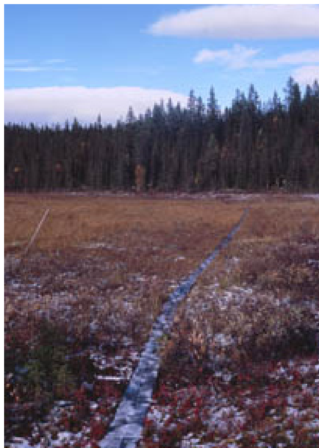
Figur 7. Spångning över myr, rester av hässjestänger i Poststigen.