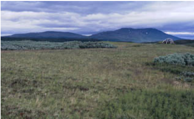
Figur 5. Tukivallen med kåtan i bortre delen; äldre kåtalämning i förgrunden.

verkar vara en husgrund. Kanske är det lämningar efter den sista gruvepoken på 1800-talet. Även vid denna stig finns kåtalämningar.