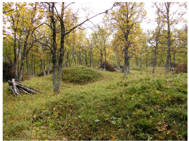
Figur 30. Välhävade gravhögar på Hamravallen.

servatet finns flera gravhögar från yngre järnåldern och ett långt fångstgropssystem (Figur 30). En skyltad Järnålders-tur berättar om fornlämningarna.