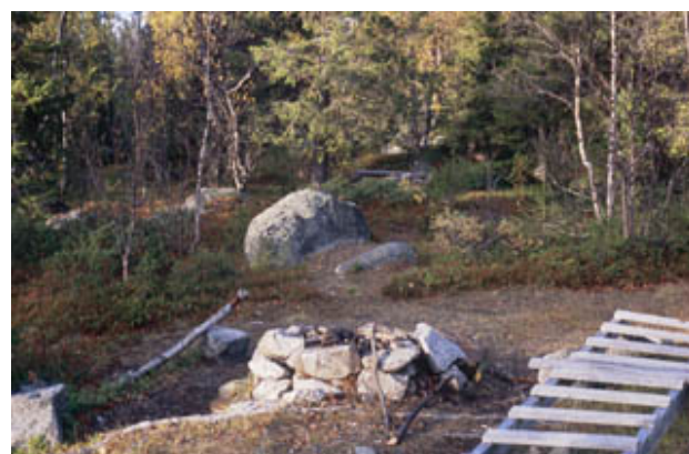
Figur 12. Moderna eldstäder uppbyggda i fornlämningsområde i Sijddoädnos mynning.

den. Det finns en container för skräp, ved för eldning är upplagd strax intill. Skyltar från länsstyrelsen upplyser om naturreservatens regler, men det finns ingen information om fornlämningarna.