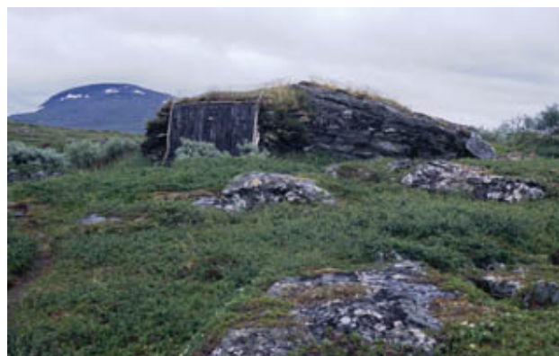
Figur 2. Restaurerat båthus i Stáloluokta.

Marken slits av många vandrare. På vissa ställen i vistet finns spänger som används. Men i backen från sjön upp mot den skymda stationen är markeringen dålig. Här ringlar minst fem parallella stigar. Bredvid den nordöstliga spången finns spår av skoterkörning på barmark. Här har varit vindblottor i april. På höjden österut långt från stigar finns en hel del spår av motorcyklar; det tycks vara sladdning från buskörning.