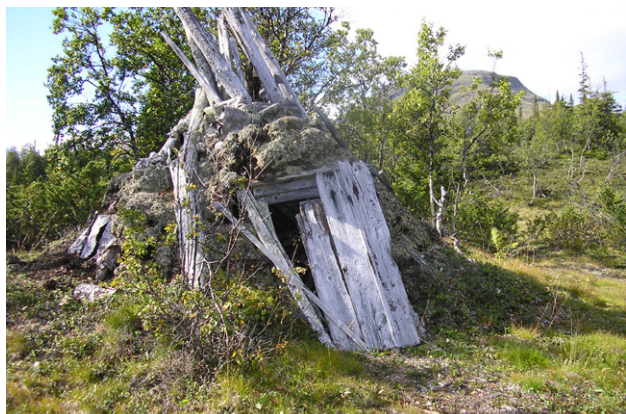
Figur 18. Skolkåtan i Kruanavaajje.

Vålådalens naturreservat ligger i Undersåkers socken, Åre kommun, västra Jämtland och bildades år 1988. Området omfattar 117 500 hektar och är lika stort som Öland. Markägare är ett antal privatpersoner, några skogsbolag samt till största delen Fastighetsverket. Reservatet omfattar stora skogsområden vid Rekdalen, Vålådalen och Rulldalen samt fjällområdena Hottögsfjället, delar av Anarisfjällen och Lunndörrens fjällen, Härjängsfjällen, Bun-