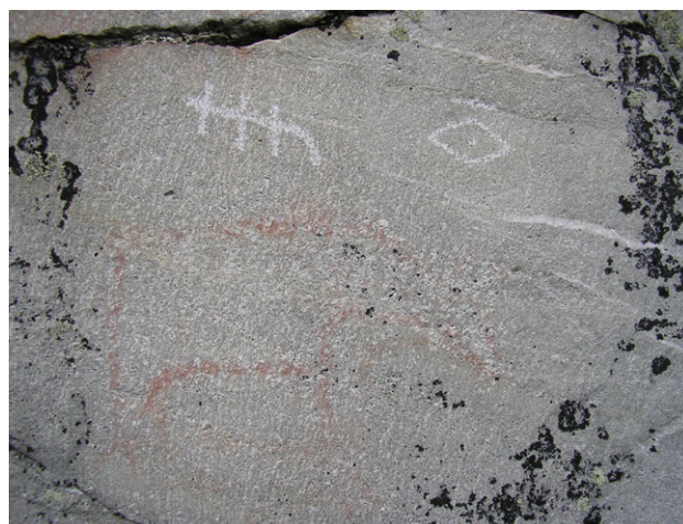
Figur 26. Hällmålning vid Rogen - sentida besökare har också markerat sin närvaro.

Även om vi informerar och sätter upp skyltar, är problemet svårlost. De flesta besökare har ingen arkeologisk kunskap och förstår inte att de tältar och eldar, där människor levat och verkat under flera tusen år. En möjlig fara med att informera kan vara att besökare plockar med sig värdefullt arkeologiskt material, framför allt stenredskap och avslag.