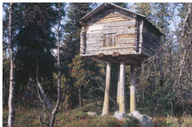
Figur 10. Restaurerad njalla i Kuorpak.

Fyrhjulingsspår finns på flera ställen. Vid besök i september 2006 fanns här tre långtidsparkerade husvagnar och ett tält samt ett tiotal bilar. Ett renstängsel följer kanten av parkeringen. Två öppningar i stängslet (den ena stor nog för fyrhjulingar) leder besökare in på östra stran-