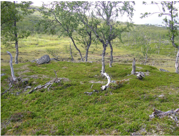
Figur 28. En av tre stalotomter i Ovrehøjke.

renvallar. Björk, gran och enstaka enbuskar håller på att invadera visteplatsen, men den framträder mycket tydligt och är med sin frodiga markvegetation klart avgränsad från omgivningen.