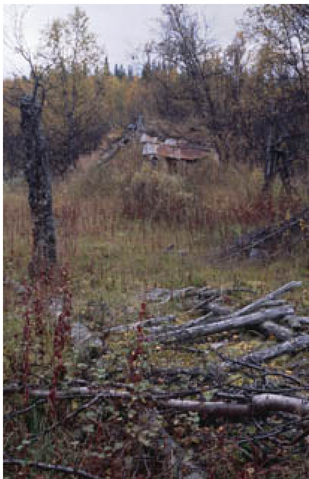
Figur 9. I förgrunden luovve i Kuorpak, delvis söndersågad till ved i modern eldstad.

Syftet med reservatet är att bevara dess naturliga och opåverkade karaktär. Ekoturism, naturupplevelser, friluftsliv och vetenskaplig forskning är andra viktiga mål med Ultevis fjällurskog.