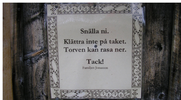
Figur 1. Det är vanligt att turisterna klättrar på kåtorna.

Besluten om inrättande av naturreservat och nationalparker studerades med avseende på beskrivning av syftet med att skydda området samt dess kulturmiljöer och skötselplaner. För de områden, som valdes ut för fallstudien, har en kortfattad historisk analys gjorts. Där-