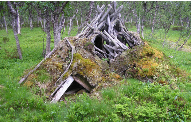
Figur 24. Rastplats i Stensdalen.

uppfatta miljön. Flera av kåtorna är nästan omöjliga att upptäcka, eftersom vegetationen är så frodig. Säkert går de flesta turisterna rätt igenom vistet utan att ha en aning om att det är en viktig samisk kulturmiljö de passerar.