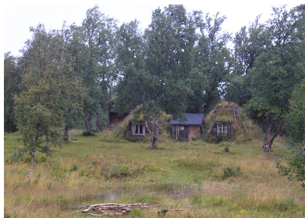
Figur 20. Kåtor för bostad och servering i Grönvallen.

Grönvallen är den enda samiska miljö i reservatet som omfattas av skötselplanen. Målet med skötseln är att bibehålla renvall och bebyggelse i hävdad skick.