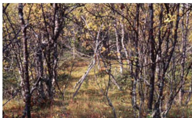
Figur 11. Suonger, äldre vistesplats.