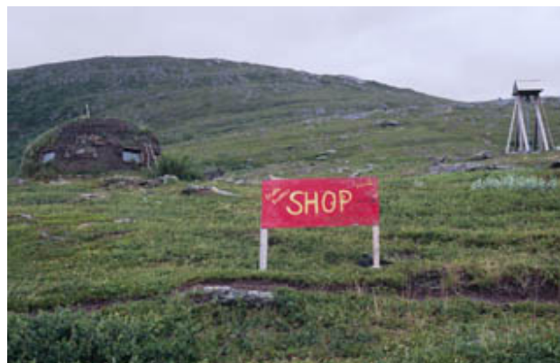
Figur 3. Skyltning nära kyrkkåtan i Stáloluokta.

Alla restaurerade byggnaderna är i mycket fint skick. Markerna runt kåtor och stugor hålls öppna med grästrimmer.