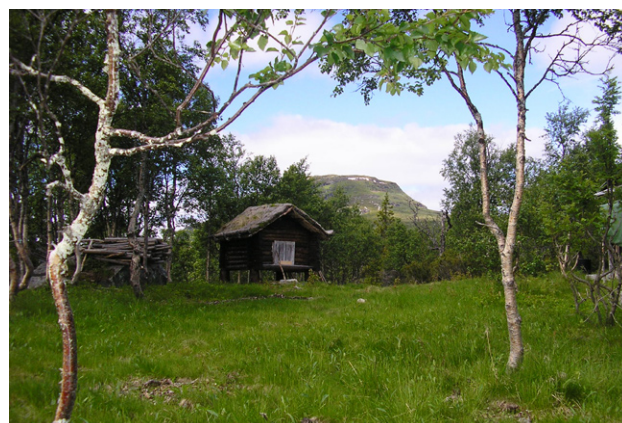
Figur 19. Restaurerad bod i Kruanavaajje.

Syftet är att bevara detta skogs- och fjällområde som innehåller bland annat värdefulla geologiska, botaniska och kulturella värden. Dessutom måste även rennäringens intressen skyddas genom att lämna naturen att fritt utvecklas.