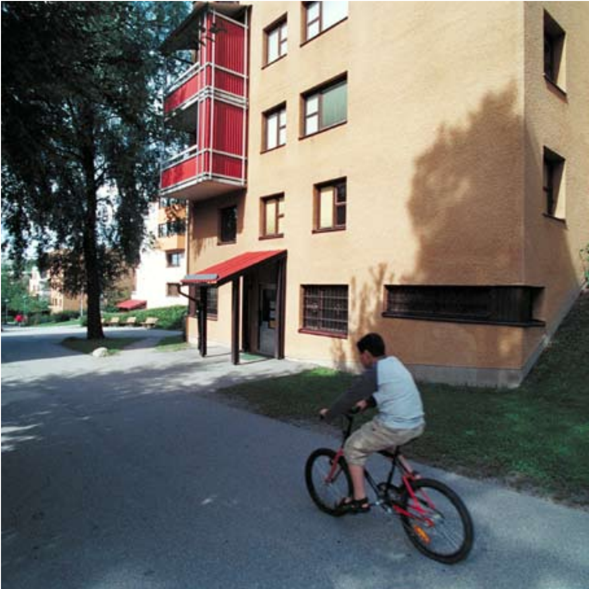
KISTA, FOTO: BENGT A LUNDBERG, PAA