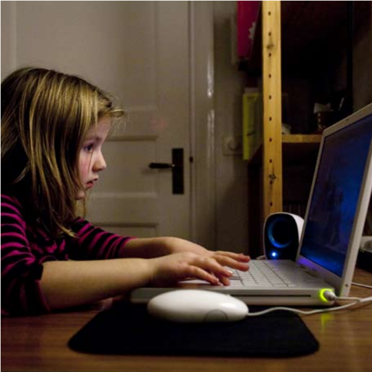
BARN VID DATOR.