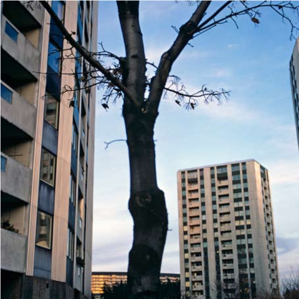
TÄBY CENTRUM.