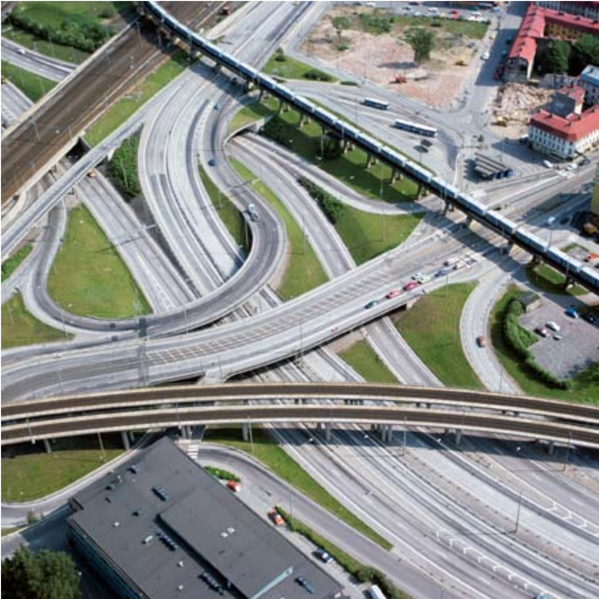
OLSKROKSMOTET, GÖTEBORG.