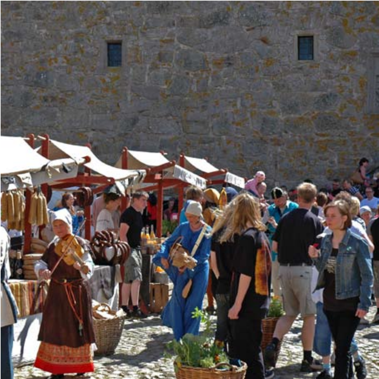
MARRNAD, GLIMMINGEHUS