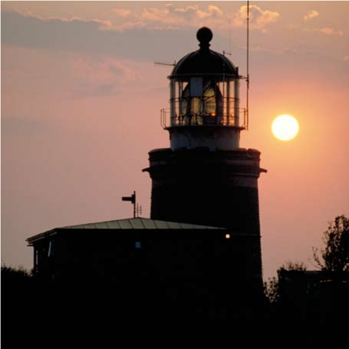
KULLENS FYR, KULLABERG.