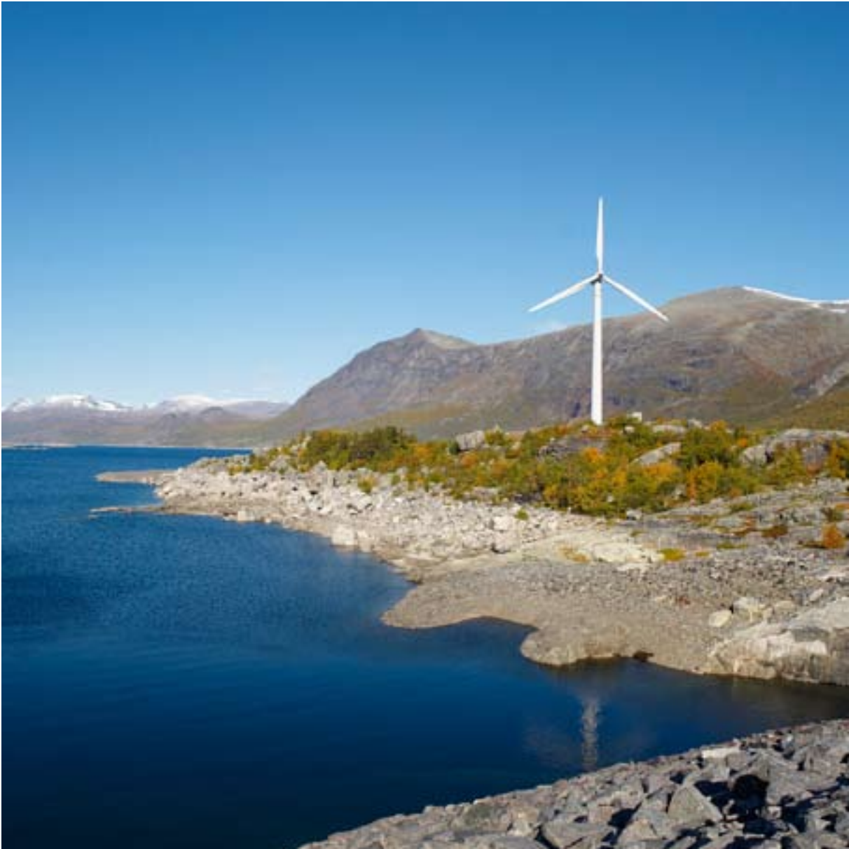
SIORVADAMMEN, GÄLLIVARE.