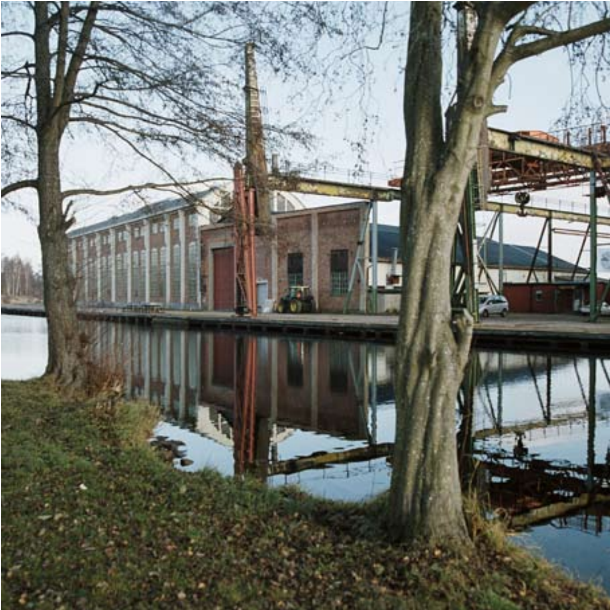
MOTALA VERKSTAD