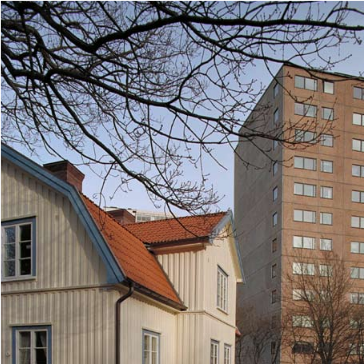
FROLINDA, GÖTEBORG.