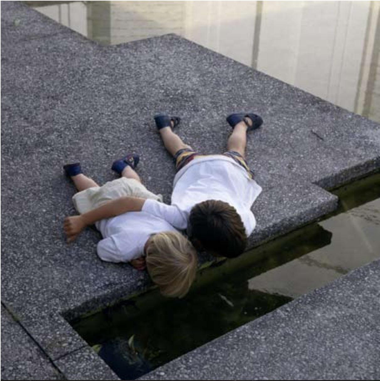
BARN VID VATTEN.