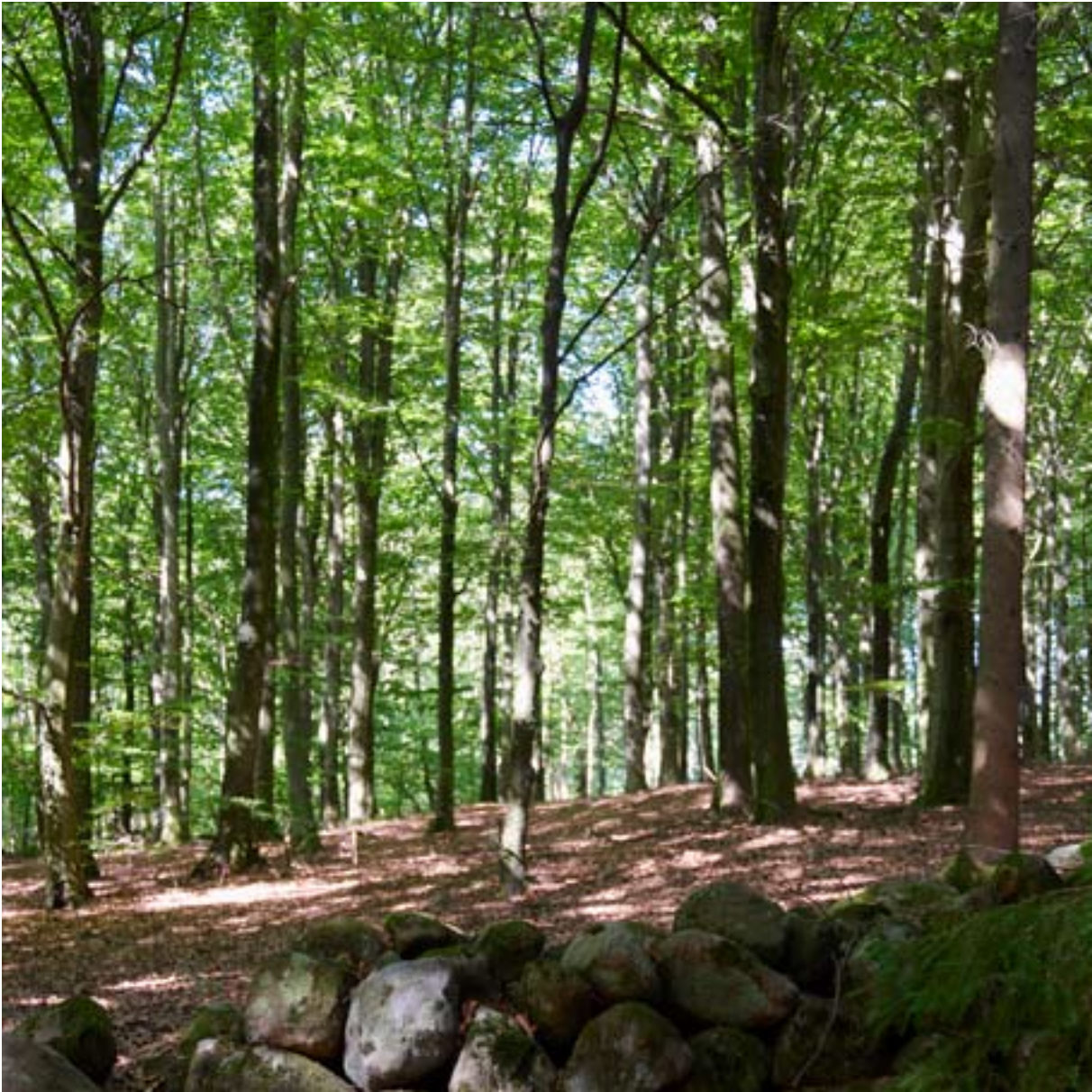
OSBECKS BOKSKOGAR, FOTO: BENGT A LUNDBERG, PAA