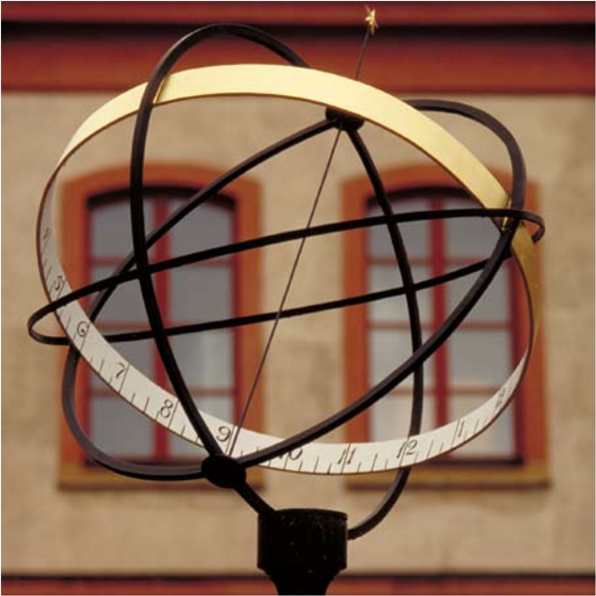
SOURVIDTULLGÄRNS SJOTT