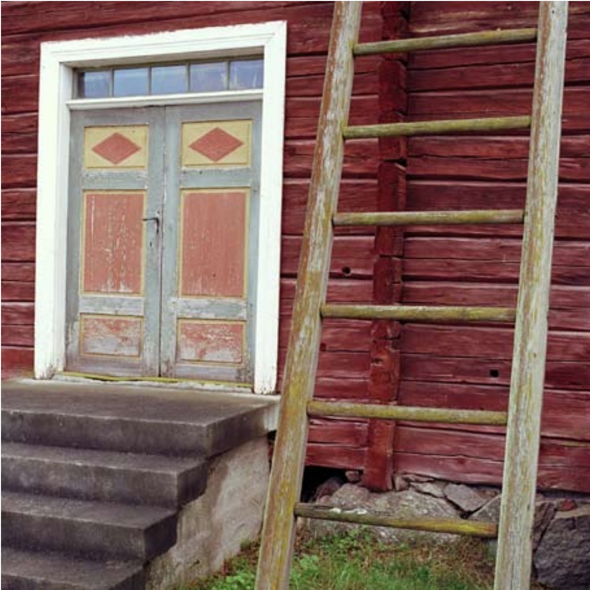
SCHÄFTNERSGÅRDEN, VÄSTERÅNG.