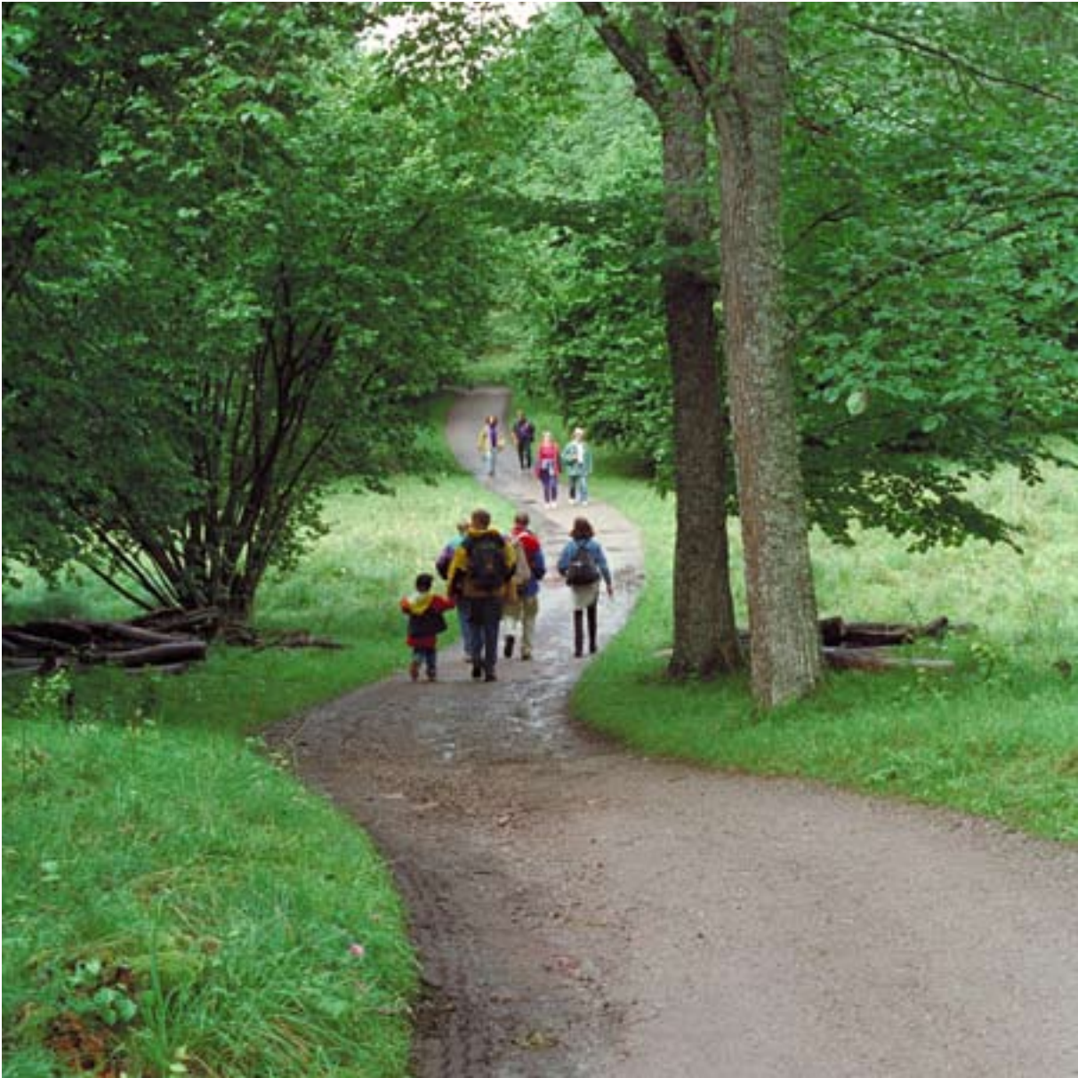
BIRKÖ BIRKA, FOTO: BENGT A LUNDBERG, PAA