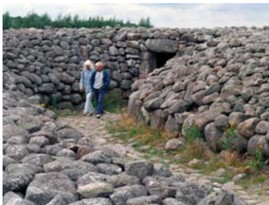
Kiviksgravens hör tillsammans med Lugnarohögen i Halland till de hårt restaurerade monumenten under tidigt 1900-tal.

Vården innebar i det här fallet en ny utgrävning och en hård strid utvecklades kring vem som skulle få genomföra den prestigefyllda utgrävningen. Det blir Gustav Hallström som undersöker graven i sex veckor, ett arbete som bl a resulterade i en mycket fin fotodokumentation. Han fann bl a delar av en svärdsknapp, en fibula och ett kallhamrat bronskärl. Därefter restaurerades röset, som man räknade med hade varit 7 meter högt från början, oerhörda mängder sten gick åt och en bunker göts över stenarna.