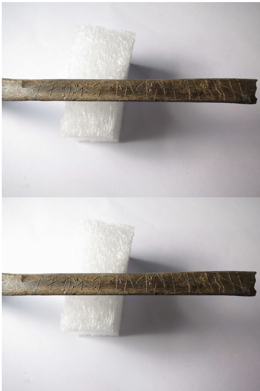
Benet efter rengöring.