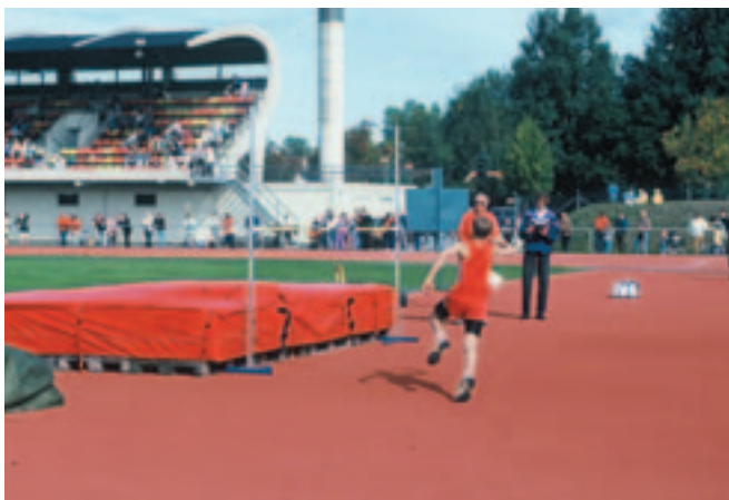
Friidrotts tävling på Backavallen i Katrineholm. Jämför utrustning, läktare och banor med bilden från Vingåker! Backavallen ligger i anslutning till multiarena, tennishall och en gymnasieskola. Namnet på den ultramoderna idrottsanläggningen är det klassiska: Vallen, där vikingatidens asagudar kämpade.

Under 1950- och 60-talet upplevde Sverige en period av obruten högkonjunktur och staten kunde satsa mycket pengar på bland annat idrottsanläggningar. Den typiska anläggningen från denna tid är en sporthall. En inomhushall gör det möjligt att ägna sig åt idrott oberoende av årstid och väder. Nya grenar som basket, handboll, volleyboll, innebandy, squash med flera blev snabbt populära och tog plats i hallarna. Många hallar byggdes nära eller i anslutning till skolor. Det var ekonomiskt om så många som möjligt kunde använda hallen: skolorna på dagen och olika föreningar på kvällar och helger. Av samma anledning var hallarna inte anpassade för någon speciell gren. Man kunde träna handboll och innebandy i samma hall. Sporthallen har efterträtt idrottsplatsen som den klassiska idrottsanläggningen.