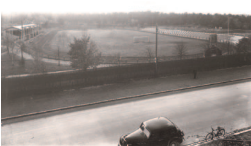
1924 invigdes Tunavallen. Det var från början en idrottsplats för både fotboll och friidrott. Idag är Tunavallen en renodlad fotbollsarena. Foto: Eskilstuna museers arkiv.