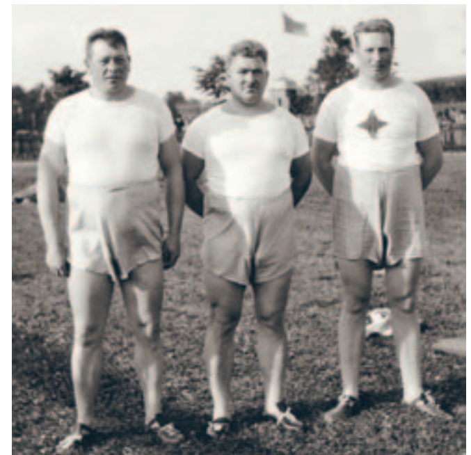
Eskilstunaidrottare för länge sedan.