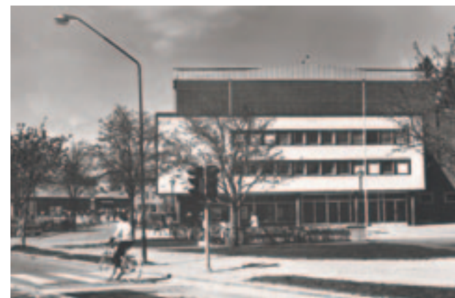
1959 invigdes sporthallen i centrum av Nyköping. Den ritades av samma arkitekt som ritat skolan i bakgrunden. En byggnad i centrum är en del av stadens officiella ansikte. Sporthallen berättar om kommunal framåtanda och omsorg om folkhälsan, om folkhemmets omsorg om medborgarna.