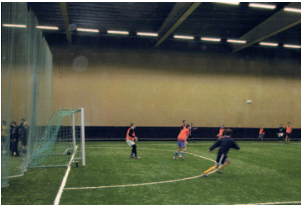
En modern idrottsanläggning är en spännande byggnad. Gå på upptäcktsfärd!

Idrottsanläggningar är byggda för att fungera för träning och tävlingar. Hur själva byggnaden ser ut tänker användarna kanske inte i första hand på eftersom det är verksamheten som står i centrum för uppmärksamheten. Ta er tid att titta ordentligt på er anläggning och undersök den! Hur ser den ut? Tycker ni den är vacker eller ful? Vad gör den vacker, ful, neutral eller spännande? Passar den ihop med sin omgivning? Känns det bra att vistas i huset? Försök tänka efter vad det är som gör att det känns bra eller dåligt! Frågorna nedan hjälper er på traven när ni ska studera idrottsanläggningen. Hitta själva på flera frågor!