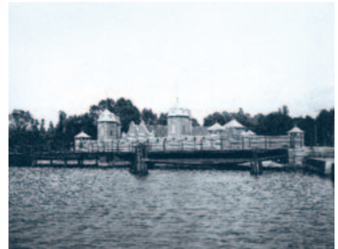
I Eskilstunaån låg en gång ett kallbadhus.

Idrottsanläggningar tar mycket plats. Det behövs parkeringsområden, för idag kommer både idrottare och publik resande med bil eller buss. Det behövs också driftspersonal för att se till att en anläggning fungerar. Därför försöker man idag rationalisera driften och koncentrerar flera anläggningar till samma område. I Eskilstuna är mycket av idrotten koncentrerad till några anläggningar i utkanten av centrum. Dessa anläggningar är byggda för att kunna ta emot stora evenemang med mycket publik.