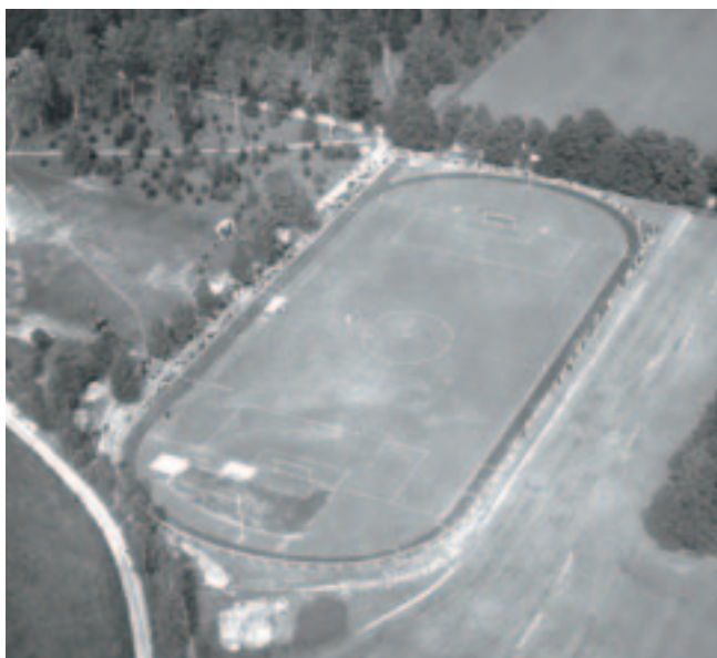
Broby idrottsplats i Bettna socken flygfotograferades 1935. Den är en av de många idrottsplatser som blev till under 1930-talet, det årtionde då idrotten erövrade landsbygden och blev en verklig folkrörelse.