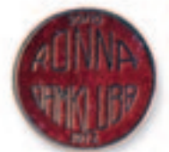
Brunnamerna har spelat fotboll sedan 1972.