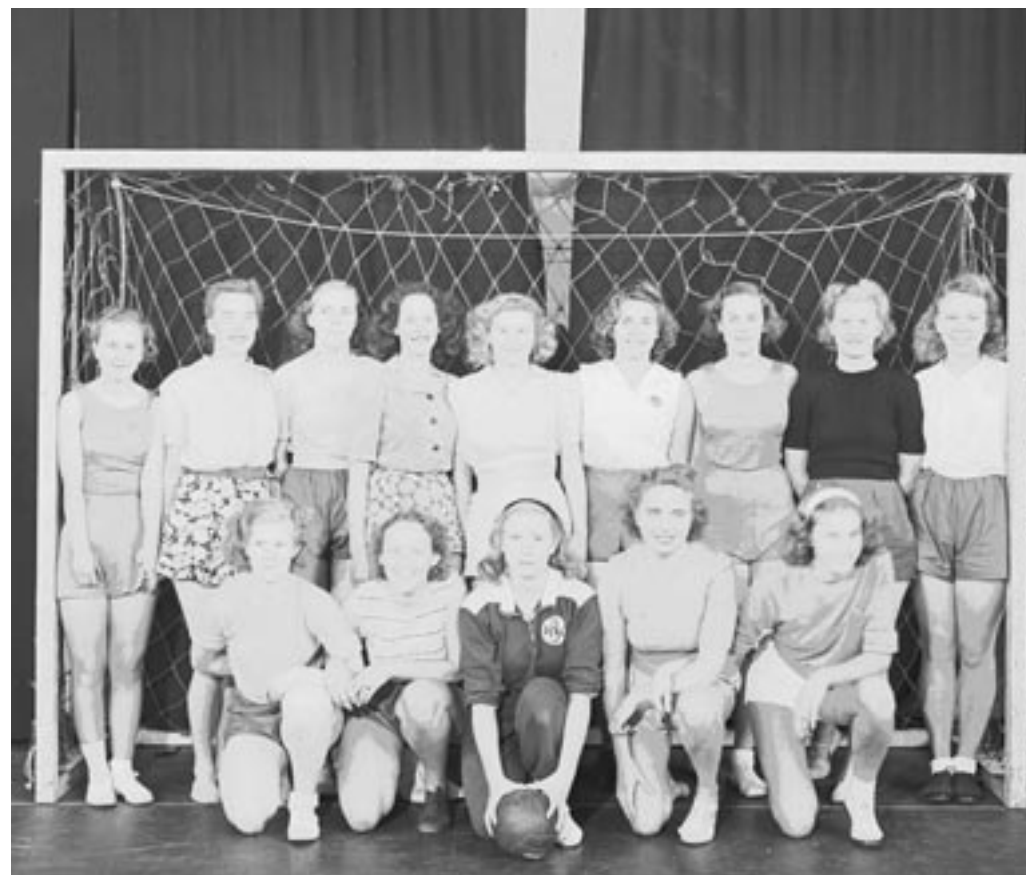
Idrottsmodet har växlat. 1946 var handbollsdamerna i Katrineholm klädda så här brokigt.