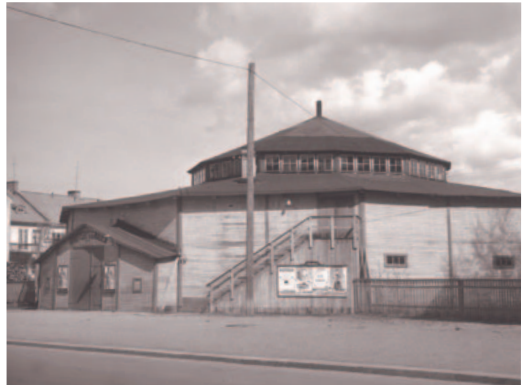
Bygget är en av de legendariska idrottsbyggnaderna i Sverige. Byggnaden uppfördes 1911 som en tillfällig lokal för brottning, men den stod kvar och användes till 1955. Det hette att man inte var färdig som brottare förrän man brottats i Bygget!