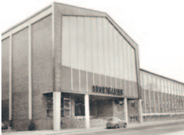
Sporthallen uppfördes 1955, i första hand för att erbjuda handbollslaget GUIF en modern arena. GUIF hade tidigare spelat i tennishallen. Det fanns också lokaler för brottning, boxning och bowling i sporthallen.

Eskilstuna är en industristad. Precis som man kan förvänta sig grundades idrottsföreningarna tidigt och det gällde att hitta lämpliga platser för idrottarna att träna och tävla på.