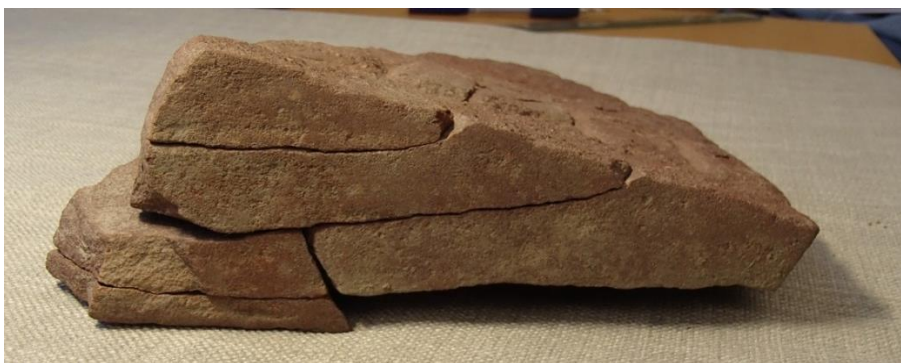
Fig. 2. Fragmentets jämna kant som visar hur stenen har skiktat sig. Foto Magnus Källström 2016.

Till läsningen: Av runa 1 finns en huvudstav bevarad i brottkanten. Endast den högra delen av ristningsspåret återstår och toppen saknas. Runan kan inte ha haft någon bistav till höger, men väl till vänster. Förmodligen rör det sig om resterna av en i -runa, men alternativen a , o och t (och i så fall med ensidiga bistavar) kan inte uteslutas. Runa 2 n har ensidig bistav till höger. Runa 3 g är tydligt stungen. Den nedre delen av bistaven genomkorsas av en lodrät spricka. Avståndet till den följande runan verkar onödigt stort. Någon runa kan inte ha funnits på denna plats, men väl ett skiljetecken. En spricka löper nämligen genom partiet och till vänster om denna finns en grundare flagring. En fördjupning 2,5 cm till höger om 3 g och omedelbart till vänster om sprickan kan möjligen vara resterna av ett sådant skiljetecken. Detta har i så fall haft formen av kort lodrätt streck ('). 4 s har haft formen ʃ . Av runan återstår det övre ledet samt större delen av mellanledet.