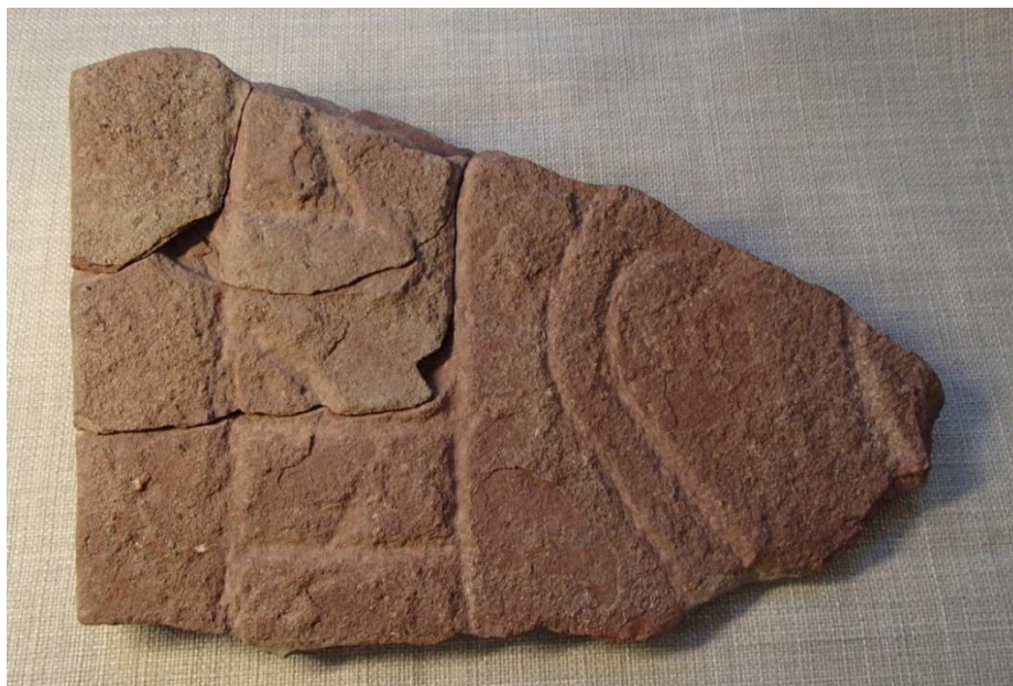
Fig. 1. Runstensfragmentet från Eds allé. Foto Magnus Källström 2016.