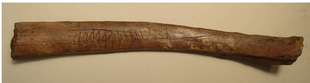
Fig. 1. Det nyfunna runbenet från kv. Humlegården.

Benet har fyndnummer 2 och kommer från ett lager som enligt Ros preliminärt kan dateras till 1000-talet (sektion 1, lager 4).