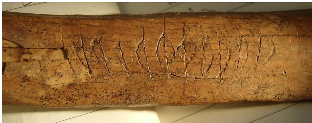
Fig. 3. Detalj av inskriften med benets bredare ände vänd åt höger.

En närmare granskning visar att ristningen måste ha utförts från två håll med utgångspunkt i de två speglade runorna i mitten (runorna 5 och 6). Genom att bistavarna i flera av p -runorna inte har dragits hela vägen in mot huvudstaven är det möjligt att någorlunda säkert bestämma i vilken ordning tecknen har tillkommit. De två \phi -runorna har troligen ristats med benets bredare ände vänd åt höger (se fig. 3). Det framgår bl.a. av att bistaven på den vänstra runan (runa 6) nedtill inte går in mot huvudstaven. Med benet vänt på detta sätt blir också bistavarna på de fyra p -runorna som vänder sig mot benets bredare ände öppna nedtill. I runan längst åt höger (runa 1 i läsningen ovan) saknar bistaven helt förbindelse med huvudstaven.