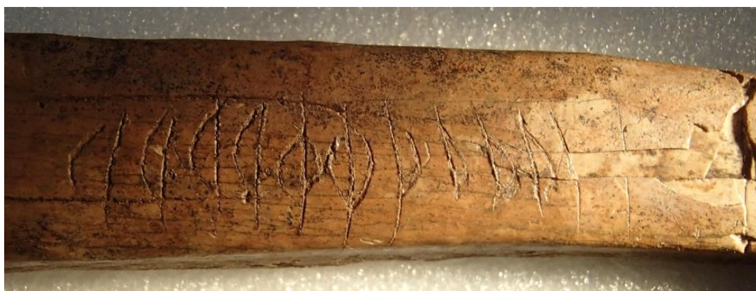
Fig. 2. Detalj av inskriften med benets bredare ände vänd åt vänster.

Inskriften finns på ett revben, som är 175 mm långt, 17–23 mm brett och 10–12 mm tjockt. Runorna är ristade på den konkava sidan av benet och inskriften står 35 mm från den bredare änden. Brottet går strax till höger om ristningen. Inskriften är 49 mm lång och består av 10–13 mm höga runor.