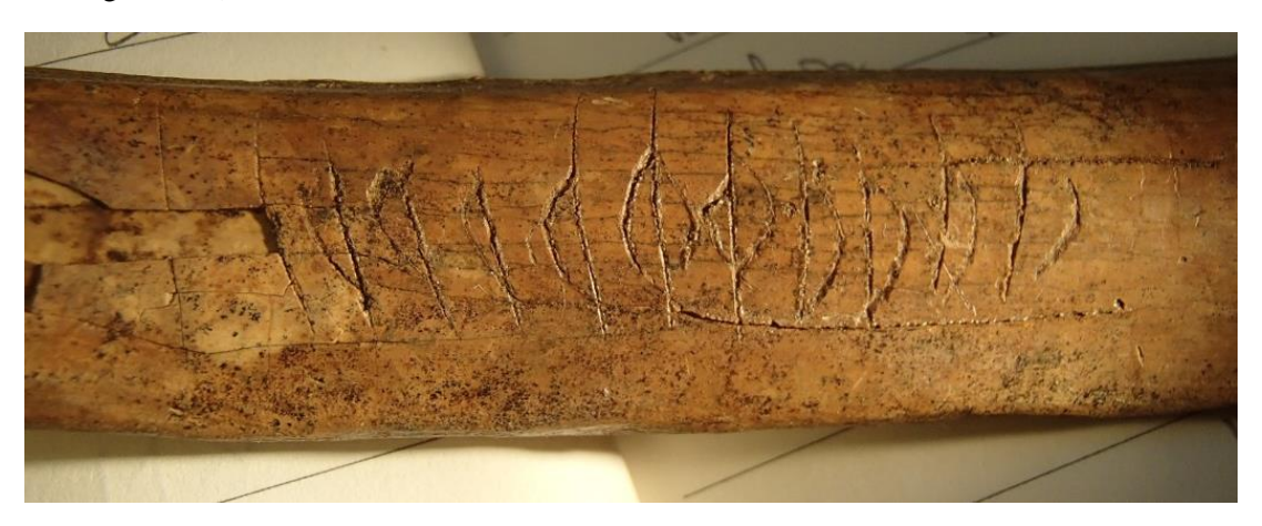
Fig. 3. Detalj av inskriften med benets bredare ände vänd åt höger.

En närmare granskning visar att ristningen måste ha utförts från två håll med utgångspunkt i de två speglade runorna i mitten (runorna 5 och 6). Genom att bistavarna i flera av þ -runorna inte har dragits hela vägen in mot huvudstaven är det möjligt att någorlunda säkert bestämma i vilken ordning tecknen har tillkommit. De två Φ-runorna har troligen ristats med benets bredare ände vänd åt höger (se fig. 3). Det framgår bl.a. av att bistaven på den vänstra runan (runa 6) nedtill inte går in mot huvudstaven. Med benet vänt på detta sätt blir också bistavarna på de fyra þ -runorna som vänder sig mot benets bredare ände öppna nedtill. I runan längst åt höger (runa 1 i läsningen ovan) saknar bistaven helt förbindelse med huvudstaven.