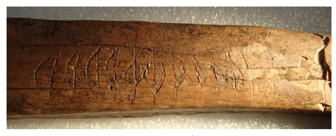
Fig. 2. Detalj av inskriften med benets bredare ände vänd åt vänster.

Inskriften finns på ett revben, som är 175 mm långt, 17–23 mm brett och 10–12 mm tjockt. Runorna är ristade på den konkava sidan av benet och inskriften står 35 mm från den bredare änden. Brottet går strax till höger om ristningen. Inskriften är 49 mm lång och består av 10–13 mm höga runor.