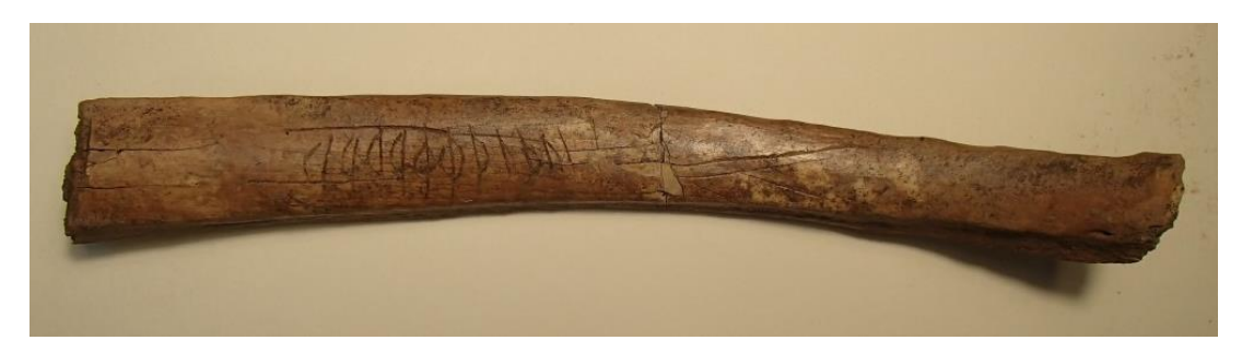
Fig. 1. Det nyfunna runbenet från kv. Humlegården.

Benet har fyndnummer 2 och kommer från ett lager som enligt Ros preliminärt kan dateras till 1000-talet (sektion 1, lager 4).