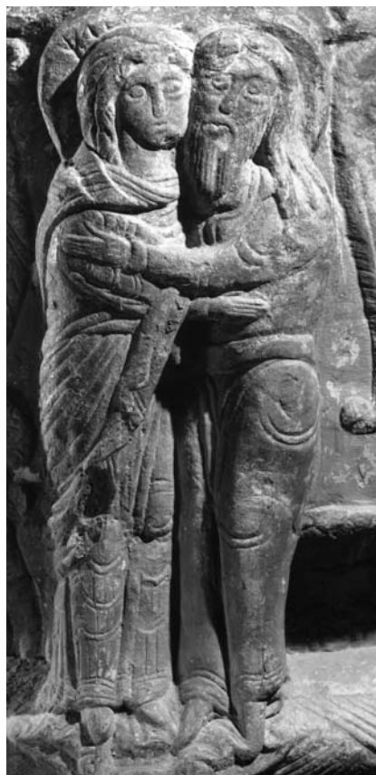
G 229a. Runorna ma -... 1987.

a. I glorian till kvinnan i människoparet syns rester av tre runor: ma- . Runan m , som är 2 cm hög, är säker. Av runa 2 a återstår nedre hälften av huvudstaven och vänstra bistaven. Av runa 3 återstår basen av en av en huvudstav, inga säkra spår av någon bistav. En liten fördjupning på platsen för spetsen i en r -bistav bedöms vara orsakad av vittring.