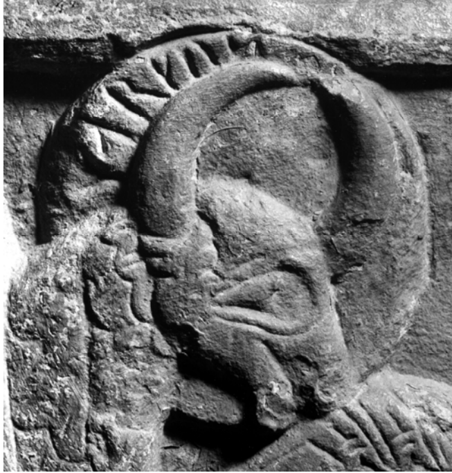
G 229d. Runorna markus . 1987.

e. Glorian på det bevingade lejonet, evangelisten Markus symbol, bär en väl bevarad inskrift med 3 cm höga runor.