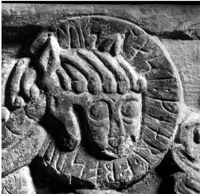
G 229e. Runorna luks last gearf : a : posu-i . Foto: Bengt A. Lundberg 1987.