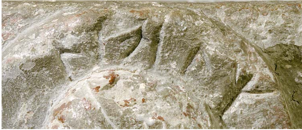
G 229b. Runorna maria . Foto: Bengt A. Lundberg 1987.

c. I glorian runt örnen i ett av bildfälten, evangelisten Johannes symbol, står en runinskrift: iohanes , dvs. Iohannes . Runorna är 1,5-2,5 cm höga och välbevarade. På i -runans mitt finns en punktartad fördjupning som bedöms vara naturlig, ej avsiktlig. Dubbelsidiga bistavar i runorna a och n . Runan e tydligt stungen med en punkt.