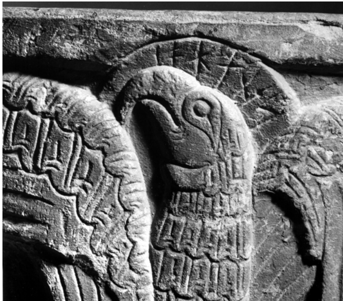
G 229c. Runorna iohanes .

c. I glorian runt örnen i ett av bildfälten, evangelisten Johannes symbol, står en runinskrift: iohanes , dvs. Iohannes . Runorna är 1,5-2,5 cm höga och välbevarade. På i -runans mitt finns en punktartad fördjupning som bedöms vara naturlig, ej avsiktlig. Dubbelsidiga bistavar i runorna a och n . Runan e tydligt stungen med en punkt.