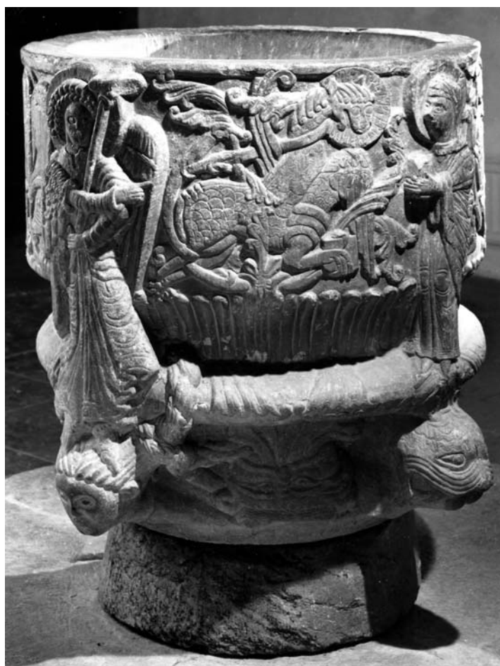
G 229. Dopfunten. Foto: Bengt A. Lundberg, 1987.

eller – mindre troligt – en symbolisk framställning av ett brudpar med Maria som brud. Vidare Maria, bebådelseängeln Gabriel och den korsfäste Kristus. Maskerna utgörs av lejon under de två första figurerna, ett människohuvud under Gabriel, en örn under Kristus och ett lejon (?) under Maria. De fyra fälten emellan figurerna fylls av evangelistsymbolerna i låg relief.