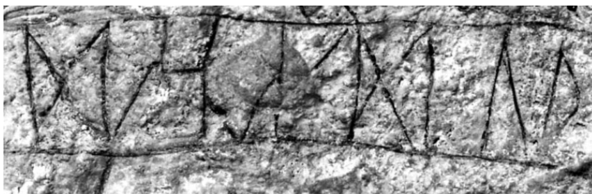
G 268. Detalj av runorna. Foto: Bengt A. Lundberg 1992.