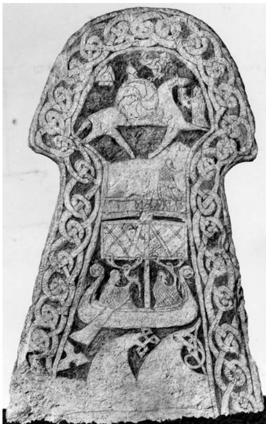
G 268. Helhetsbild. Foto: Bengt A. Lundberg 1992.