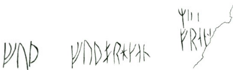
G 267a-c. Avritning av I. Andersson 1955.

Eftersom ristningarna inte har varit tillgängliga för undersökning kan läsningen inte kommenteras i detalj. Inskrift a består av de tre första runorna i runraden; inskrift b av större delen av runraden, medan inskrift c inte ger någon språklig mening.