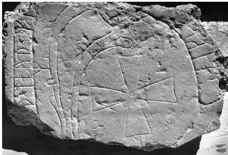
G 270.

Till läsningen: Runorna t , a och m har dubbelsidiga bistavar. 1 h och 3 k har förlorat ett litet stycke av huvudstavens bas. 2 e är liksom 12 e stungen med en ovanligt liten drillad punkt. 3 k är inte stungen. I 4 u är nedre hälften av runan bortfallen. Av runa 5 återstår en cm av