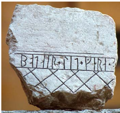
G 274.