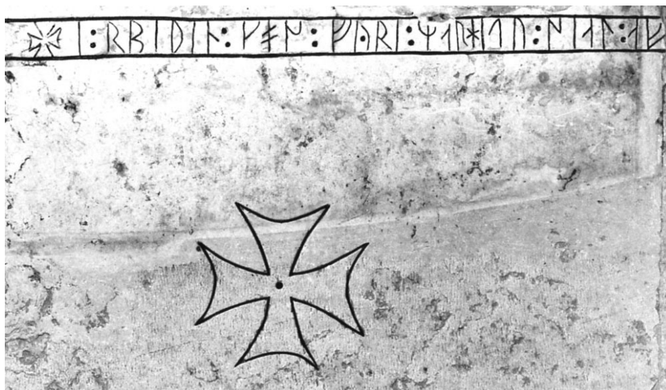
G 282.

Till läsningen: Runorna är ojämnt formade, slitna och grunda med tunna ristningslinjer. De skiljer sig markant från de djupa ramlinjerna, skiljetecknen och korset. Inskriften inleds med ett litet kors. Runorna a och n har ensidiga bistavar; s -runorna har gotländsk form. I 2 r är bistavens övre del mycket grund, toppen och basen av huvudstaven är skadade genom flagring. Av 3 b saknas nedre bistavens anslutning till huvudstaven genom den sekundärt upphuggna ramlinjen. Samma gäller 5 p , vars bistavar ansluter till huvudstaven vid ramlinjerna. Basen av huvudstaven i 8 k är bortnött. 9 o har dubbelsidiga bistavar, ej parallella med varandra. I mellanrummet mellan andra och tredje ledet i 10 s finns en punktformad naturlig fördjupning. 12 y är stungen med en djupt huggen punkt; runans topp är något skadad genom vittring. Toppen av huvudstaven och toppen av den högra bistaven i 15 m är borta i en skada; samma gäller toppen av huvudstaven i 16 a . 17 r ger intryck av att ha ristats i efterhand som rättelse, runans nedre del är försliten. I 18 h är huvudstavens övre hälft skadad genom vittring. Basen av 19 i är försliten. I 20 t är huvudstavens bas borta i en vittringsskada; den ensidiga bistaven är lång och något böjd. På grund av stympningen av hällen saknas spetsen av den övre bistaven och övre hälften av den nedre bistaven i 27 f , bistavarna är ovanligt lågt ansatta.