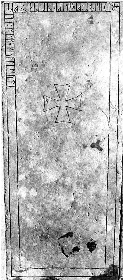
G 284.

Till läsningen: Runorna är överlag mycket grunda på grund av trampslitning och läsningen har gjorts vid släpljus. Skiljetecken saknas på flera ställen. s -runorna har gotländsk form. 1 b , som ej har full runhöjd, är kraftigt sliten. den nedre bistavens ristningsbotten är skönjbar, den övre kan endast anas. En spricka i hällens övre högra hörn går genom runan och har tagit bort basen i 2 i . I 3 p är huvudstavens topp bortnött, runan har stor påse. Den ensidiga bistaven i 5 n är svagt böjd och går ända ned till ramlinjen, samma gäller 13 n . 7 o har dubbelsidiga bistavar; den nedre är tydlig, den övre är skönjbar endast vid gynnsam belysning. I 8 s är det tredje ledet helt förslitet. Av 11 r