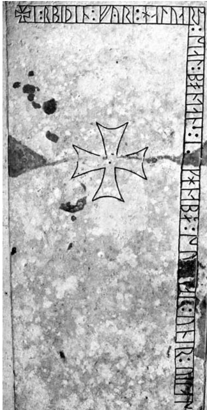
G 283.