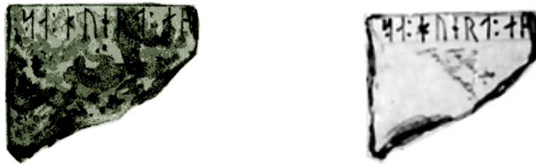
G 318. Avbildningar i P. A. Säves Reseberättelse 1852 respektive handteckningen 1849.

Runföljden 26-34 finns på det av P. A. Säve längst ner till vänster avbildade fragmentet.