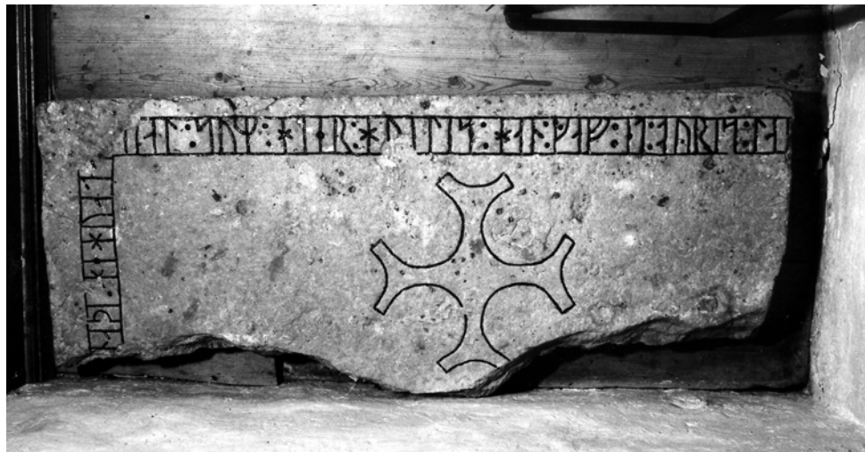
G 317. Foto: Helmer Gustavson 1979.

»Gud vare nådig Hegvats själ som här vilar. Han gav ett öresleje i år ... åt den heliga... (Ma)rgit(?) lät... Bedjen för Margits själ. Botulfr i Medebys(?) förde mig hit.»