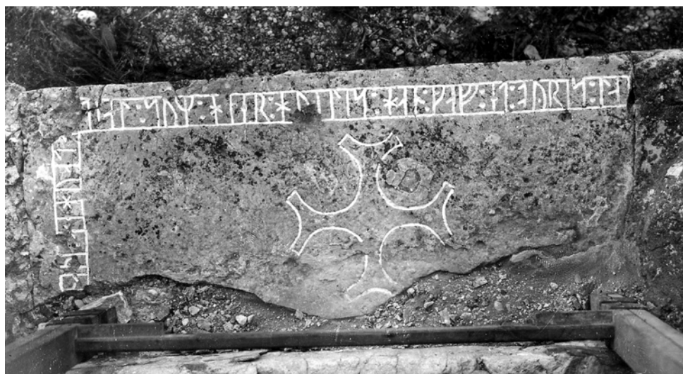
G 317. Foto: J. W. Hamner 1923 (ATA).

stor vittringskada i fragmentets övre högra hörn. Av 15 s återstår drygt nedre hälften av huvudstaven, inga spår av bistaven. Toppen av huvudstaven i 16 i borta; snett över huvudstavens bas finns en avlång naturlig fördjupning. I 17 a finns en punktformad naturlig fördjupning på huvudstavens mitt. Sådana naturliga fördjupningar finns på ett flertal ställen på ristningsytan, bl.a. i huvudstaven i 10 h och i bistaven och huvudstaven i 34 n . 1 s , 31 s och 44 s har formen av spegelvänt gotländskt s . 23 i har naturliga punktformade fördjupningar i huvudstavens bas och topp. 25 och 42 r har öppen form. Nedre hälften av 27 u är borta i en vittring, likaså basen av 28 i . 35 g är stungen med en punkt, likaså 41 y . Av 47 i kan nu endast övre hälften av huvudstaven skönjas, resten borta i brottet.