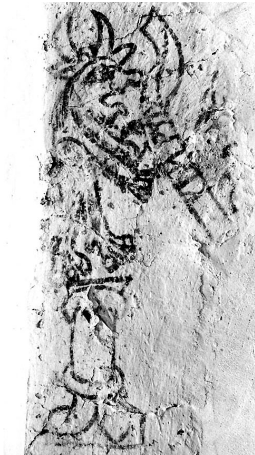
G 324.

Skvaller-scener är vanliga motiv i kyrkornas kalkmålerier över hela Sverige (B. Söderberg, De gotländska passionsmålningarna och deras stilfränder (1942), s. 309-312.) Deras uppgift är att påminna människorna om att inte uppföra sig olämpligt under gudstjänsten, gräla eller skämta. I den medeltida predikosamlingen Själinna Tröst (utgiven av Samuel Henning i SHSS nr 209) finns, under rubriken Her sigx huru thu skalt hafwa thik i kyrkionne , följande berättelse: ”En gång när en helig biskop höll gudstjänst såg hans mässdjäkne djävulen sitta i en glugg och skriva ner alla dem som viskade och tisslade i kyrkan. När pergamentet var fullskrivet tog djävulen det mellan tänderna och försökte spänna ut det för att få plats med flera namn. Men när han drog i skinnlappen gick den plötsligt sönder och djävulen for bakåt och slog huvudet i väggen, då log mässdjäknen. Då straffade biskopen djäknen och frågade varför han log. Djäknen berättade vad han sett. Då manade biskopen djävulen att berätta vad han skrev. Han svarade: ”Jag