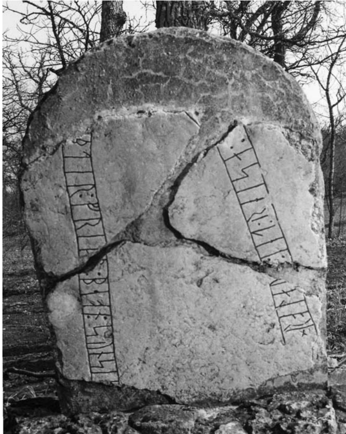
G 325. 1981.

Till läsningen: I 1 r är huvudstaven grund men tydlig, toppen är borta i en vittring och bistaven är vittringsskadad på två ställen. Runan har varit mycket smal till formen. 2 o har ensidiga bistavar snett nedåt vänster. 3 l är vittringsskadad i toppen, men bistavens ristningsbotten är bevarad i vittringen. I 4 a är basen borta i brottkanten; den dubbelsidiga bistaven är tydlig. Av 5 u återstår 5 cm av huvudstaven och 3 cm av bistaven, resten av runan är borta i brottkanten. Troligen har en runa gått förlorad mellan de båda fragmenten, där en liten kilformad bit av stenen är borta.