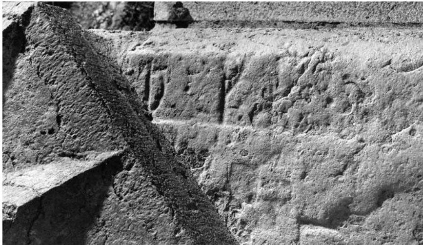
G 321. Foto: Bengt A. Lundberg 1993.

Till läsningen: Runa 1 þ har stor påse, huvudstavens nedre del är dold av pelarfundamentet. 2 k är 10 cm hög, bistaven och huvudstavens topp är utvittrade. Av runa 3 återstår utvittrade rester av en huvudstav. Av 4 e återstår svaga rester av huvudstavens ristningsbotten; på halv runhöjd finns en djup grop som bedöms vara rester av runans stingning. 6 cm till höger om runa 4 ansas möjligen svaga rester av en huvudstav. Därefter inga säkra rester av ristning på den mycket vittrade ytan. Närmast dörren är stenens kant dold av murbruk, därunder skönjes streck som skulle kunna vara toppar eller baser av 7 runor.