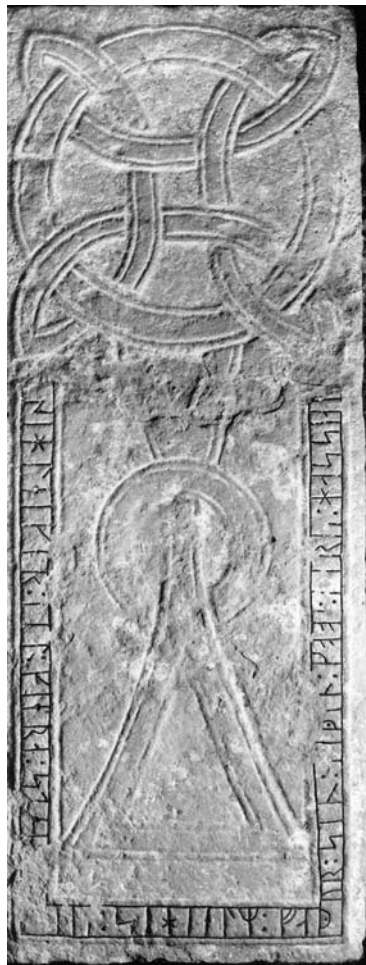
G 322. Foto: Bengt A. Lunberg 1989.

»Sigleik lät göra stenen efter Sighjälrm, sin fader. Bedjen om godhet (dvs nåd) för hans själ.»