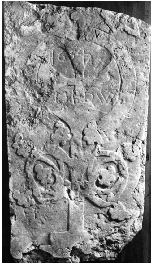
G 320. Foto: Bengt A. Lundberg 1987.