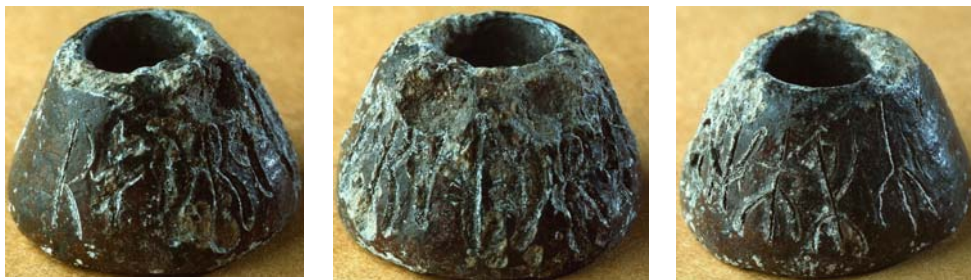
G 326.

Till läsningen: 1 r har sluten form. 2 o har dubbelsidiga bistavar, snett uppåt höger. 3 p är skadad på flera ställen genom bortfall på ytan. 4 r är skadad i toppen. 5 i består av ett lodrätt streck, på båda sidor om huvudstavens mitt finns djupa skador. I runa 6 är u är säker, från bistavens övre del går en linje snett uppåt höger, den vänder sen i skarp vinkel och svänger in mot bistavens bas, troligen skall den uppfattas som