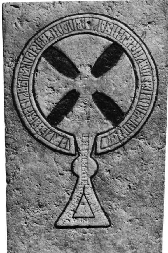
G 319. Foto: Bengt A. Lundberg 1987.

»Sigtryggs(?) arvingar läto göra stenen över Audvald(?), sin broder, som dog i Finland...»