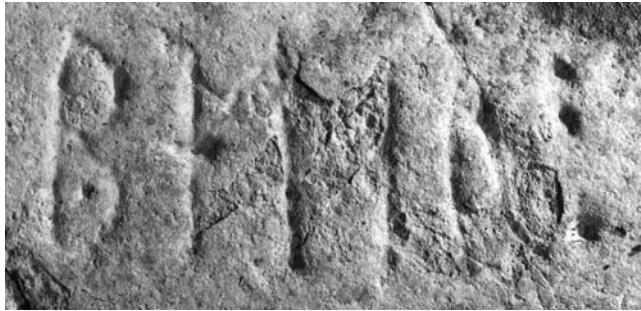
G 338. Foto: Bengt A. Lundberg 1993.

Till läsningen: Runa 1 p är stungen med en punkt i den nedre öglan; runans mitt med bistavarnas ansättning mot huvudstaven är vittrad. 2 e är stungen med ett kort vågrätt streck på huvudstavens mitt. 3 t har ensidig bistav. I 4 a är bistaven kort, grund och utvittrad. I 5 r huvudstavens bas och bistavens nedre streck mycket utvittrade. Inskriften avslutas med ett skiljetecken i form av tre punkter.