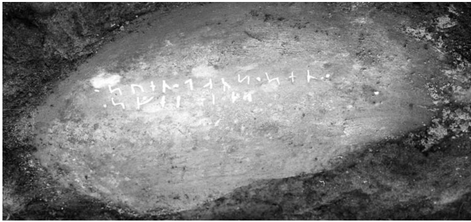
G 339. 1922.