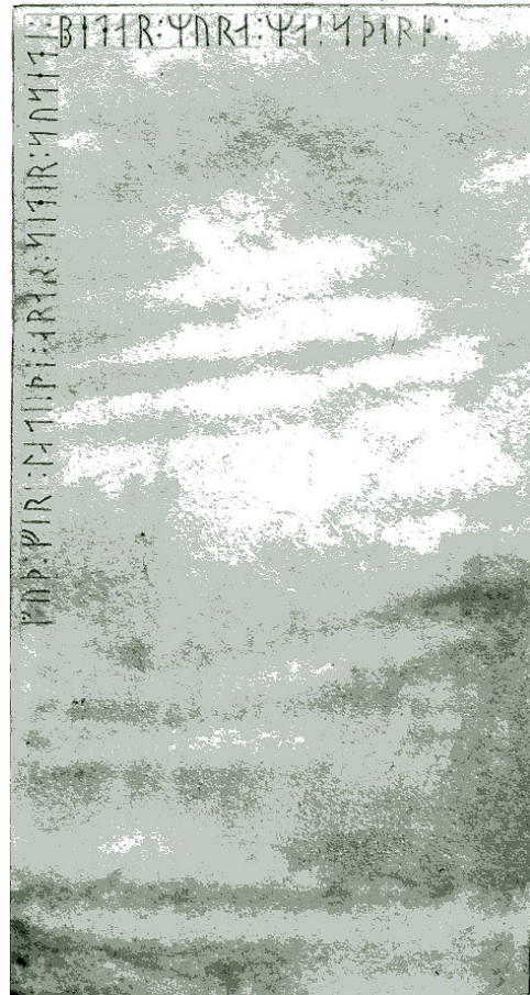
G 336. Teckning av C. G. Hilfeling (hs F m 57:9, tab.19).