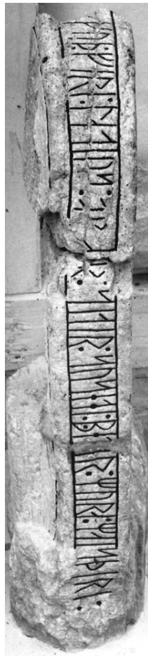
G 337. Foto: Bengt A. Lundberg 1989.

»Gud förlåte oss våra synder, så sade Petar murarmästare.»