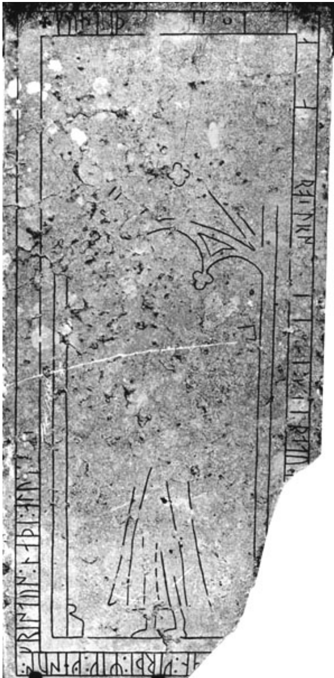
G 334. Foto: Lennart Lindquist 1983.

Till läsningen: Inskriften inleds med ett litet likarmat kors (3,5x3,5 cm). 1 k kan följas som en mörkare skuggning i ristningsytan. Inga spår av stinging. I 2 u är ett stycke av huvudstavens övre del borta i en rund vittring; likaså bistavens nedre spets. I 3 p är basen och ett stycke av huvudstavens mitt borta i en vittring; av bistaven kan övre hälften iaktas. Av 4 n återstår en grund och diffus huvudstav, inga spår av bistaven; det samma gäller 5 a . 6 p kan följas genom ytterst grunda och