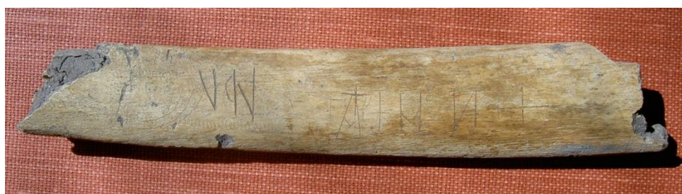
Fig. 1. Runbenet SI 115 från kv. Kammakaren 5. 2011.

Benets längd 136 mm, bredd 24 mm och tjocklek 10 mm. Runhöjd 11 mm (runan I). Inskrifterna står centralt på benet.