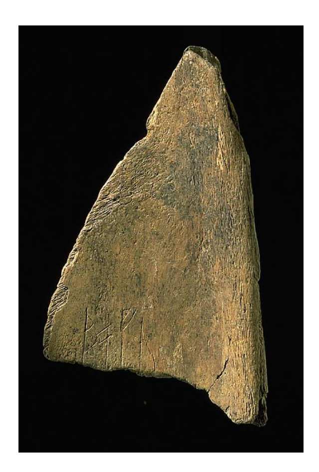
Fig. 1. Runbenet SI 43 från kv. Professorn 2. Foto Bengt A. Lundberg 1996 (RAÄ/KMB fd965131).