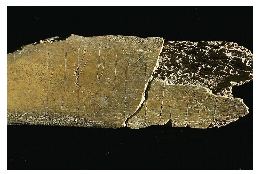
Fig. 2. Detalj av inskriften på Sl 53.