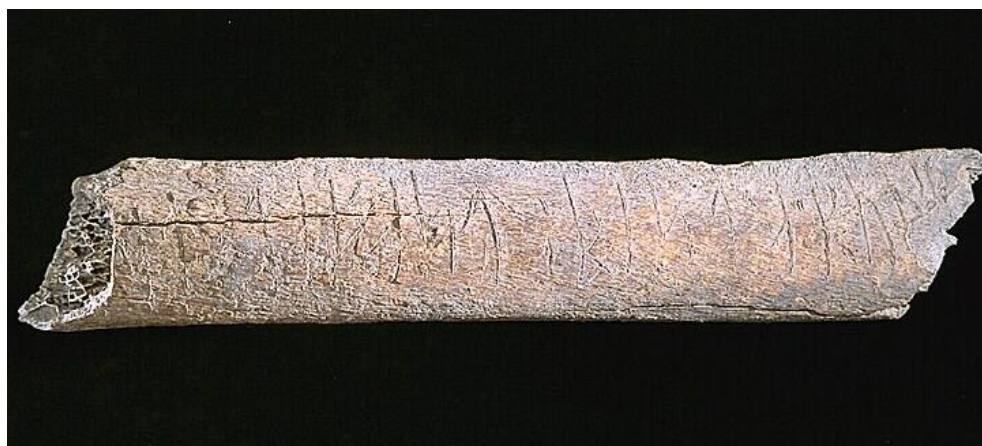
Fig. 1. Runbenet SI 63 från kv. Professorn 1.

Ett revben med runinskrift påträffades den 28 juli 1999 vid en arkeologisk undersökning i kv. Professorn 1. Fyndet gjordes i ett avsatt kulturlager i utomhusmiljö i dropprummet mellan två hus (Ruta G14. Kontextnummer 627. Fyndnummer 50406). Enligt museets föremålsdatabas hör runbenet hemma i perioden 1206–1230. Benet är 146 mm långt, 25 mm brett och 7 mm tjockt. Runornas höjd 12 mm. Dess vänstra kortsida är diagonalt och snett avskuret, den högra snett avbrutet.