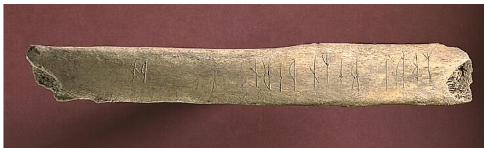
Fig. 2. Runbenet SI 71 från kv. Professorn 1 i Sigtuna. Runorna på sida B. Foto Bengt A. Lundberg 1999, RAÄ (KMB f9916102).

liksom 24 t dubbelsidig bistav. Mellan 19 m och 20 r är ett mellanrum på 13 mm, jämfört med 7 mm mellan runorna i futharkinskriften. Bistaven i 22 p är högt placerad och runan ser ut som en spegelvänd storbokstav P.