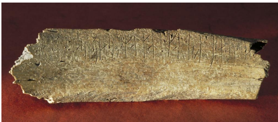
Fig. 4. Runbenet Sl 9 från kv. Guldet 15, sida B.