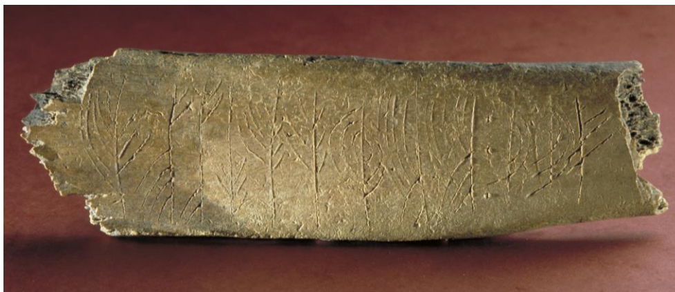
Fig. 3. Runbenet Sl 9 från kv. Guldet 15, sida A.