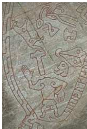
Regin med avhugget huvud. Omkring honom ligger hans smedverktyg. Djuret uppe till vänster har tolkats som Regin's och Fafnes bror Utter