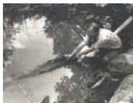
I vattnet invid Ramsundsristningen återfanns 1990 en runristad sten