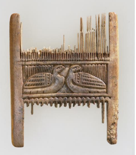
Fig. 1. Foton av kammens framsida och baksida. Foto Bengt A. Lundberg 2002 (RAÄ/KMB D0201007 resp. D0201001).