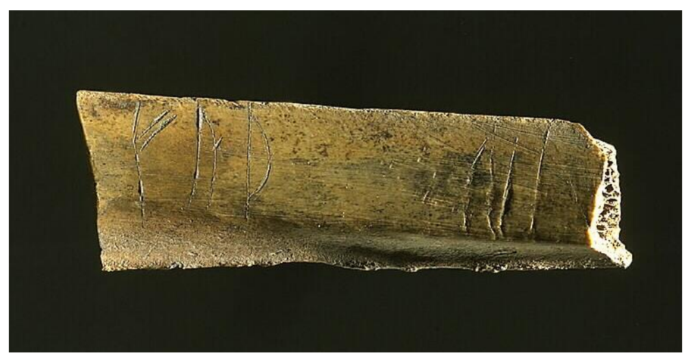
Fig. 1. Runbenet Sl 54 från kv. Professorn 4.

Revbenets längd är 80 mm, bredd 28 mm och tjocklek 6 mm. Runhöjd 18 mm (1 f). Längst till vänster på den ena bredsidan står inskrift A, till höger och vänd upp och ner jämförd med inskrift A står inskrift B. Inskrifterna läses från vänster.