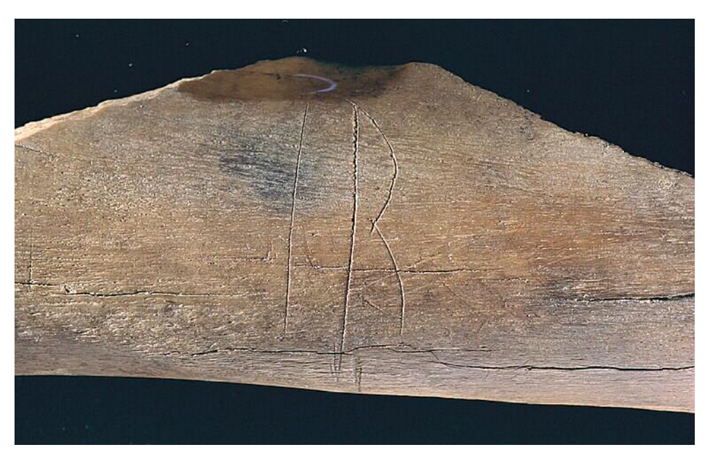
Fig.2. Detalj av inskriften på Sl 80 från kv. Professorn 1 i Sigtuna.