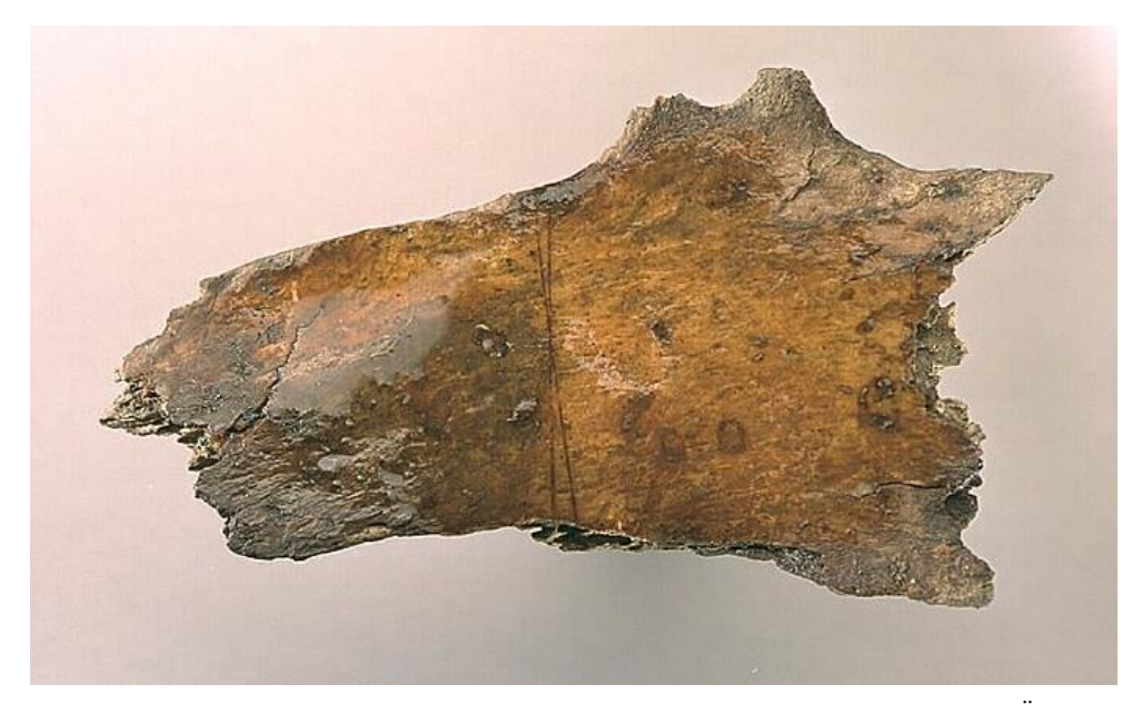
Fig. 1. Baksidan av runbenet Sl 93 från kv. Professorn 1.