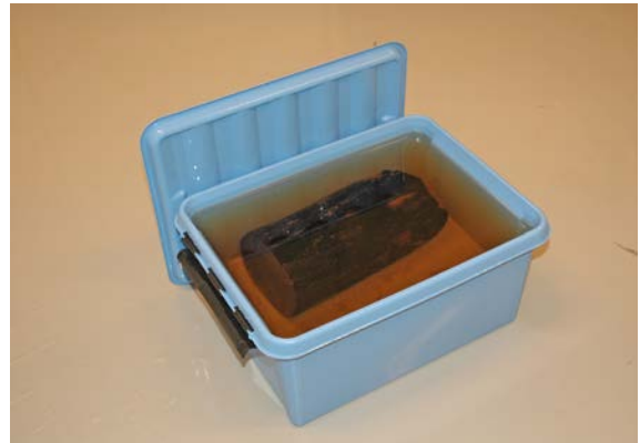
Träföremål nedsänkt i vatten.