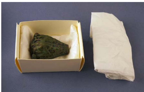
Se till att föremålen inte rullar omkring i förvaringslådan.