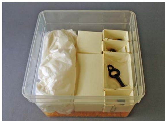
Fyll upp tomma utrymmen i förvaringslådan.