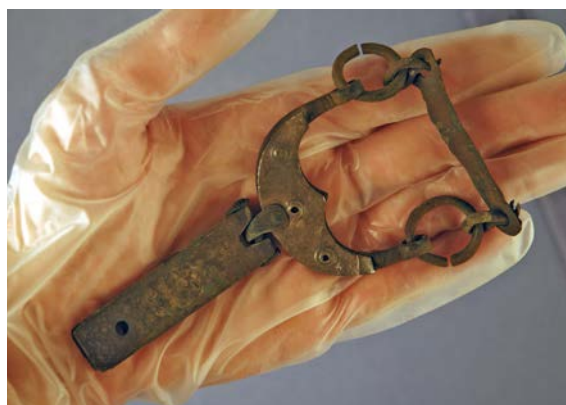
All hantering bör ske med handskar.