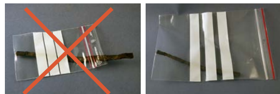
Inte så här.

Använd tillräckligt stora förvaringspåsar.