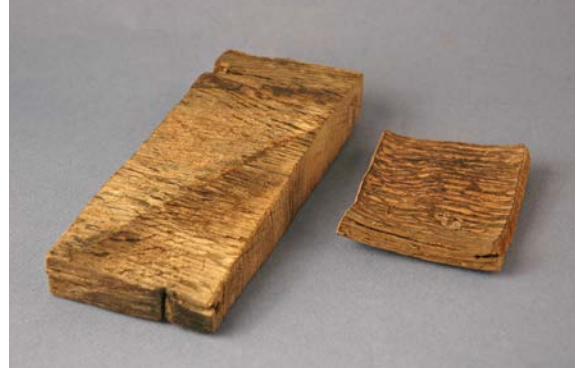
De två trästyckena var från början i samma storlek. Trästycket till vänster har konserverats. Trästycket till höger har fått torka okontrollerat utan någon konservering och har därmed deformerats och fullständigt förlorat sin ursprungliga form.