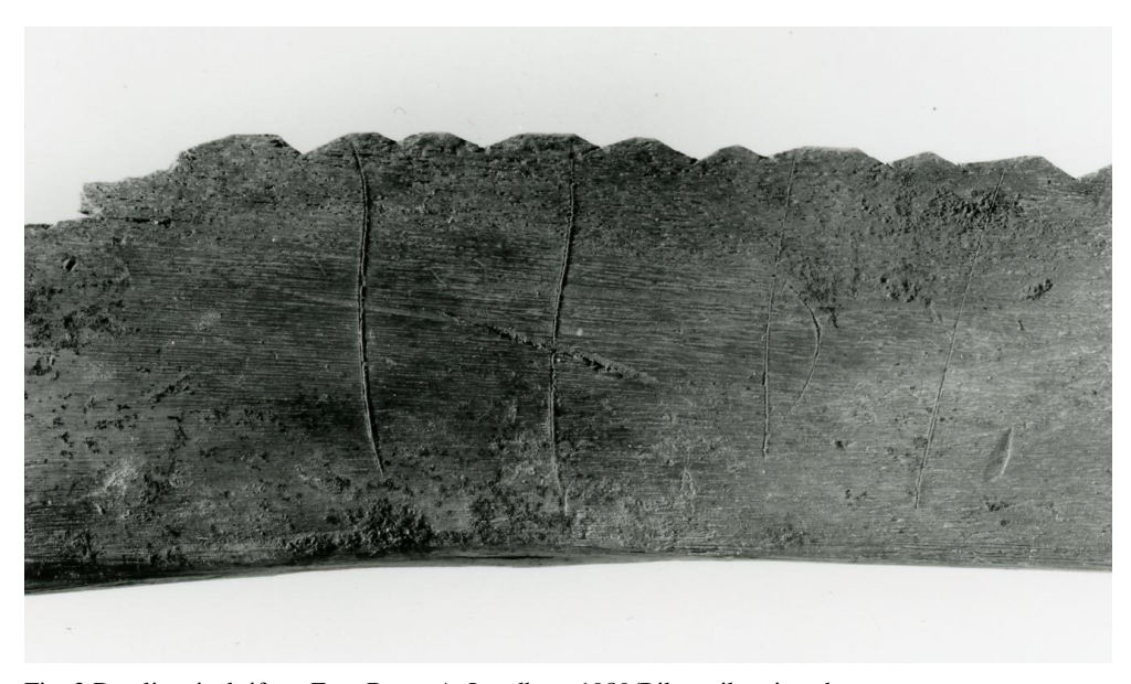
Fig. 2 Detalj av inskriften. Foto Bengt A. Lundberg 1989/Riksantikvarieämbetet.