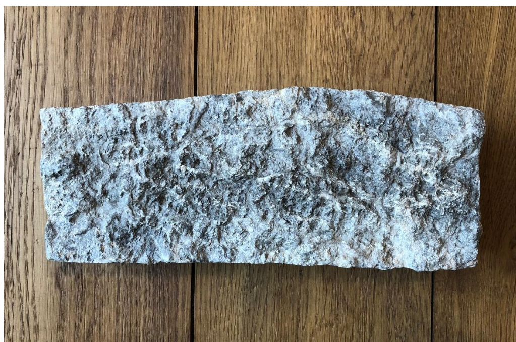
Fig. 2. Baksidan av runstensfragmentet från Hagby kyrka. Foto Magnus Källström 2019.

Runföljden auk återger givetvis konjunktionen ok 'och' (eller möjligen det likalydande adverbet med betydelsen 'också'). Om det rör sig om konjunktionen och denna har ingått i en resarformel bör den föregående r -runan svara mot den sista runan i ett personnamn.