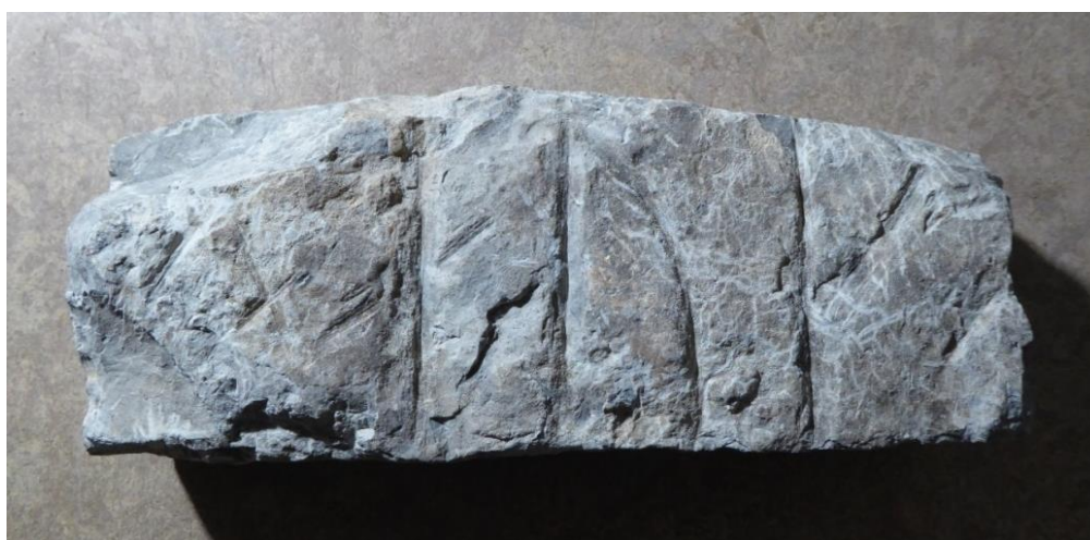
Fig. 1. Det nyfunna runstensfragmentet från Hagby kyrka. Foto Magnus Källström 2018.

Jag undersökte stenen första gången hos Arkeologerna i Linköping den 19 november 2014 med kompletterande granskning och fotografering den 12 april 2018.