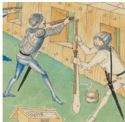
Soldater med bössor

Bilden är beskuren.