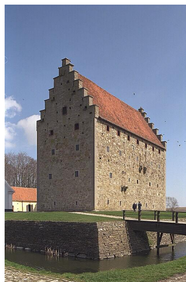
Vallgrav runt borgholmen