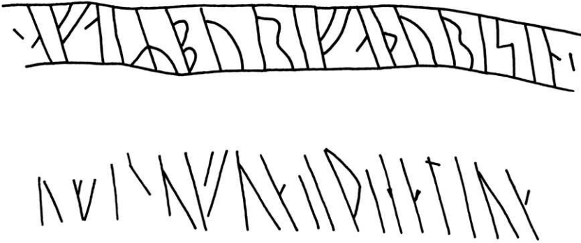
Figur 9. Jämförelse mellan runorna på Nalbystenen i Medelpad och tränskriften från Staraja Ladoga. Renritning: förf.

den stavlösa varianten av runorna u , p och r . 22 Det måste också poängteras att de originella dragen i de medelpadska runinskrifterna härrör från flera olika skriftbrukare, vilket visar att det rör sig om något mer än bara personliga egenheter. Hur begränsat materialet än är, kan vi åtminstone leka med tanken att det var precis så här som vardagsskriften såg ut i Mellannorrland under vikingatid.