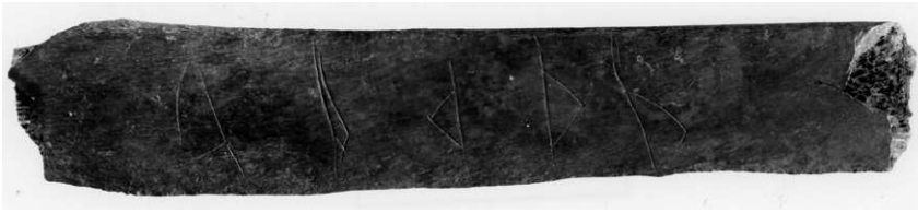
Figur 8. Runbenet SI 20 från kv. Trädgårdsmästaren. De fem tecknen representerar troligen en skrivövning där någon övat på att framställa runan p .

benet med latinsk text genomgående har o -, n -, a - och t -runor med ensidiga bistavar ( þ , ʀ , ʁ , 1 ) och att s -runan här har formen 1 .