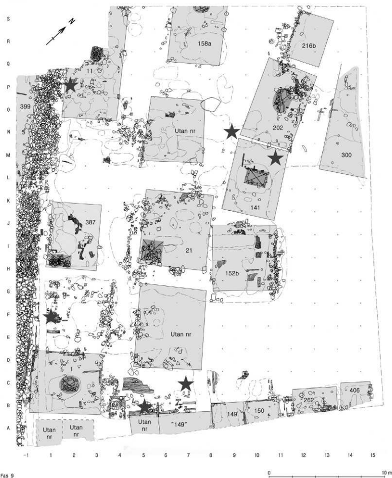
Figur 4. Exempel på spridningen av runristade föremål inom i kv. Trädgårdsmästaren i fas 9 (1200–1230). Grundplanen efter Wikström et al. 2010.

runfynd registrerade. 6 Två av dessa är runstensfragment, medan de övriga utgörs av olika typer av lös föremål. Av de senare kan 22 föras till bestämda fyndplatser och faser (se som exempel fig. 4 nedan).